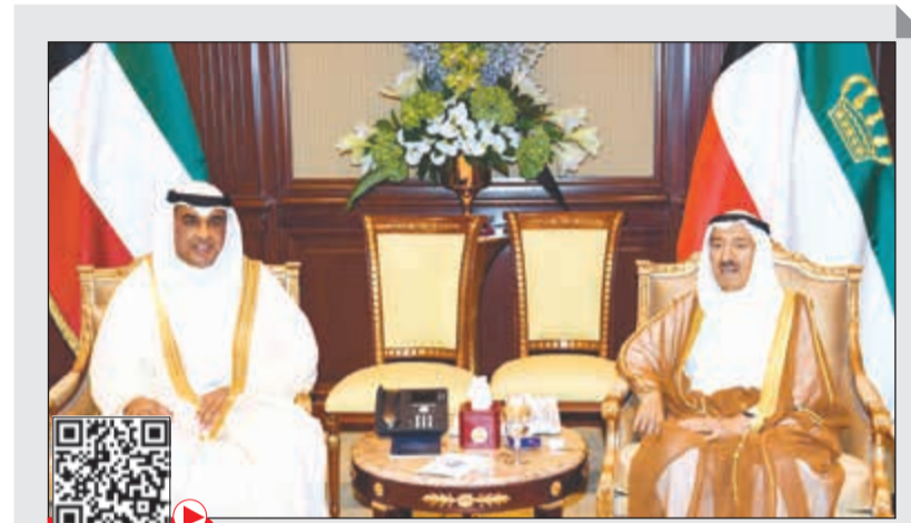
صاحب السمو الأمير الشيخ صباح الأحمد لدى استقباله المستشار عبدالرحمن النمش

وافق المجلس الأعلى للقضاء على الاقتراح بقانون المقدم من النائب عبدالوهاب البايطين بشأن تعديل قانون المرافعات المدنية والتجارية والذي يهدف الى تضييق نطاق أوامر المنع من السفر على نحو يستبعد منه المواطن المدني الذي لا تتجاوز قيمة دينه ألف دينار. ورد المجلس الأعلى للقضاء في مذكرة، حصلت «الأنباء» على