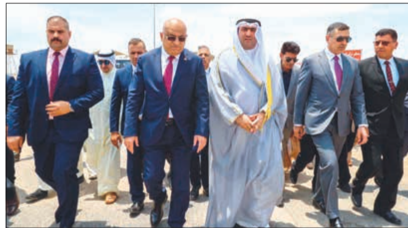
الوزير خالد الروضان لدى وصوله إلى منفذ «سفوان - العبدلي» وفي استقباله الوفد العراقي

كونا: ترأس وزير التجارة والصناعة ووزير الدولة لشؤون الخدمات خالد الروضان وفدا رفيع المستوى خلال لقاء وفد حكومي - عراقي أمس في منفذ «سفوان - العبدلي». ووضع الجانبان خلال الزيارة للمسات الأخيرة قبل توقيع الاتفاقية الخاصة بالبدء في إنشاء «السوق الكويتية - العراقية