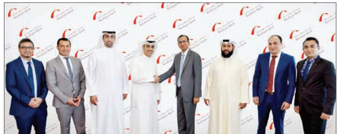
ممثلو «بوبيان» و«Ripple.Net» بعد التوقيع على الاتفاقية

التوحيجي: نسعى لمواكبة التطورات التي من شأنها تقديم أعلى مستويات الخدمة لعملائنا