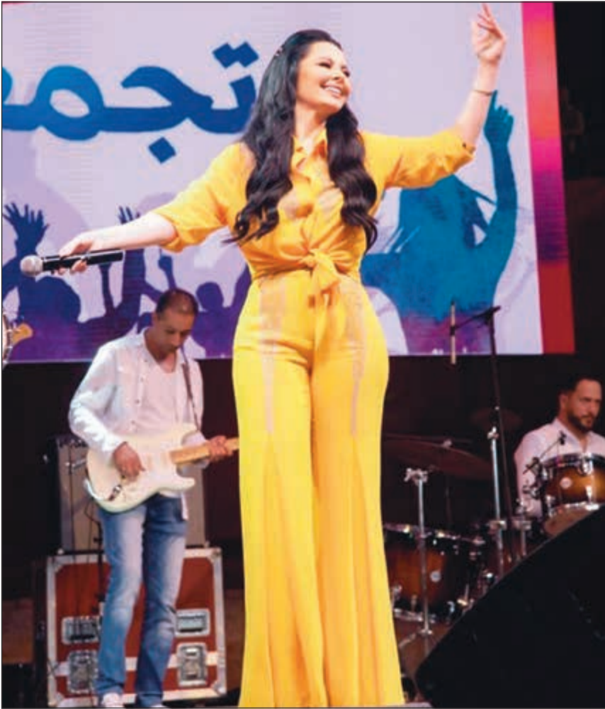
ديانا كرزون في حفلتها في «صيف عمان»

أغنية «أرنية هالليلة» ليكون الجمهور مع آخر أعمالها الغنائية «فرحتنا الليلة» والتي حققت نجاحا كبيرا وانتشارها محليا وعربيا. كما قدمت سوبر ستار العرب ديانا كرزون مجموعة من أغنياتها التي أشعلت أجواء صيف عمان بأغنية حنا كبار البلد وأغنية فدوى ليعيونك يا اردن وأغنية هيليا يا اردنية، والعديد من الأغنيات والمواويل التي شهدت جميعها تفاعلا كبيرا، فيما ضجت ساحات حدائق الحسين بالهتافات باسم سوبر ستار العرب ديانا كرزون وعلى وقع أغنية اسمر يا الشعب المهيوب تفاعل أحد الأطفال مع نجمة مهرجان صيف عمان لتطالب بصعوده على المسرح ويشاركها الرقص والغناء وسط أجواء الفرح والسرور التي ارتسمت على وجه عبود لهذه اللفتة الرائعة، ولم يغب عن سوبر ستار العرب فلسطين لتغني أغنية «وين على رام الله» مؤكدة خلال أغنياتها أن الأردن وفلسطين شعب واحد.