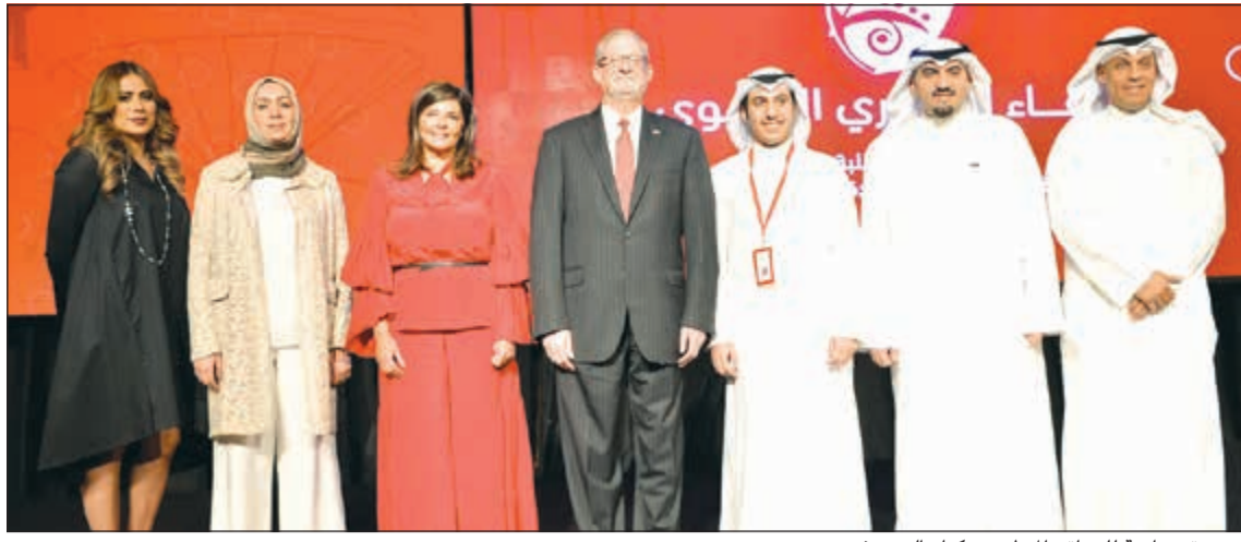
صورة جماعية للزراعة والمنظمين وكبار الضيوف