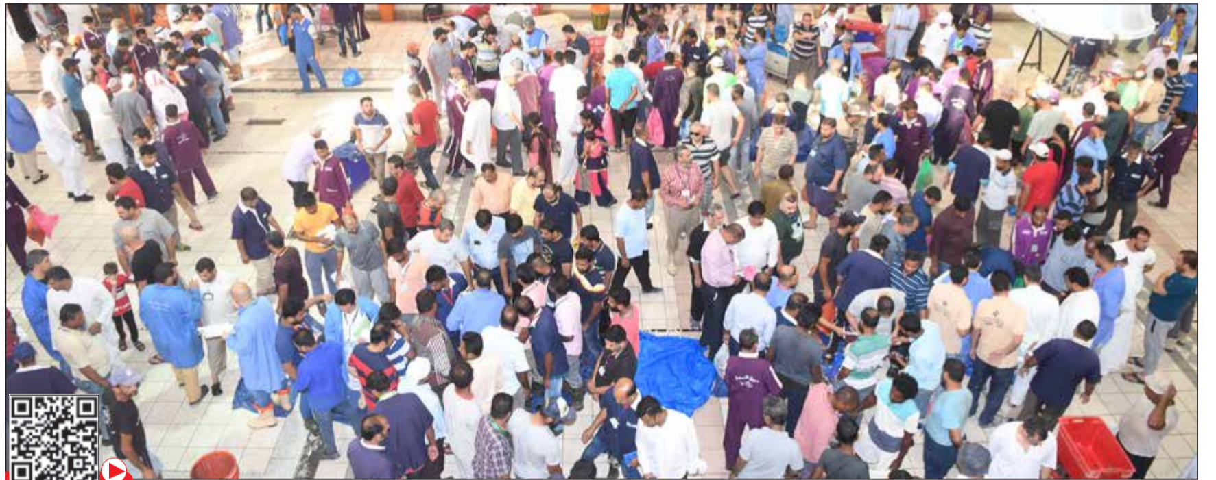
إقبال على سوق السمك في أول أيام صيد الزبيدي

متسوقة: «نبي نشم الزبيدي» تداول ناشطون على وسائل التواصل الاجتماعي مقطعاً لإحدى السيدات المتذمرات من أسعار الزبيدي المرتفعة وهي تقول: «نبي نشم ونشوفه بس».