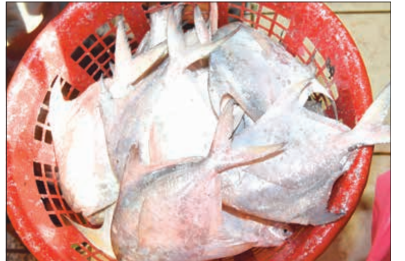
سعر الكيلو وصل إلى 14 ديناراً