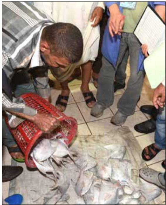
المزاد على الزبيدي