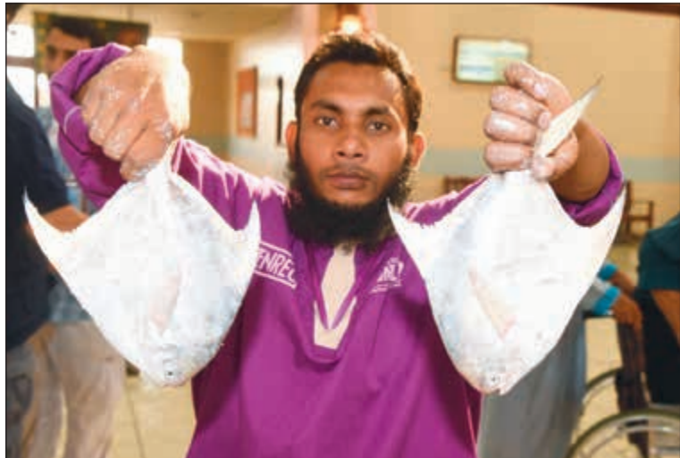
لحد البائعين يعرض الزبيدي

بعد انتظار دام 45 يوما عاد الزبيدي لينزل إلى الأسواق بقوة ولكن بسعر مرتفع دهش الكثير ممن حضروا خصيصا للحصول عليه وتزيين الموائد به، ولكنهم لحظة رؤية الزبيدي يميل السوق بسلاله تتبدت رهبة السعر الذي تراوح ما بين 8 و14 ديناراً للكيلو امام مشهد السمك الذي يعد من اهم الاسماك لدى المواطنين والمقيمين في حين تراوح الكود بين 70 و130 ديناراً بحسب الأحجام. «الأنباء» جالت في سوق السمك في اليوم الاول من السماح بصيد