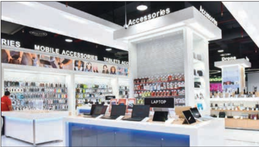
أجهزة كمبيوتر وأكسسوارات