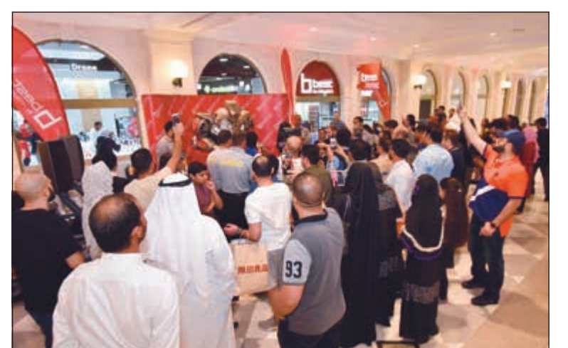
جمع من الحضور في افتتاح «بست» في الأقنيوز