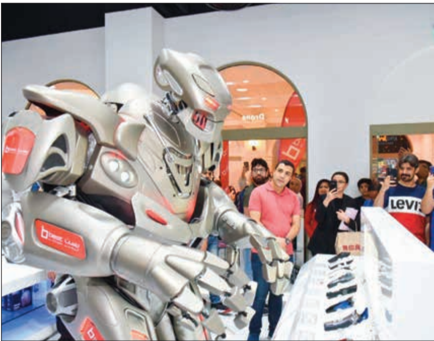
الروبوت في جولة خلال الافتتاح