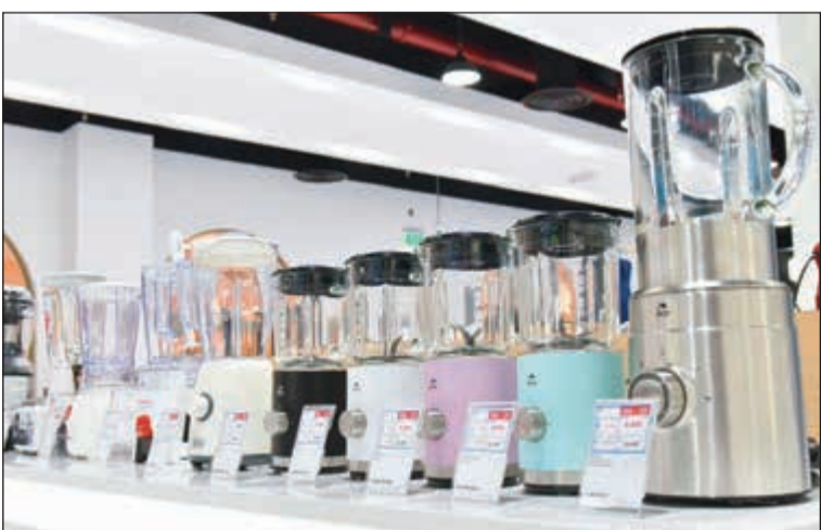
بست اليوسفي.. علامة الجودة