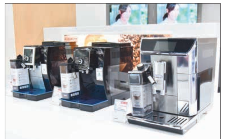
أجهزة لإعداد القهوة