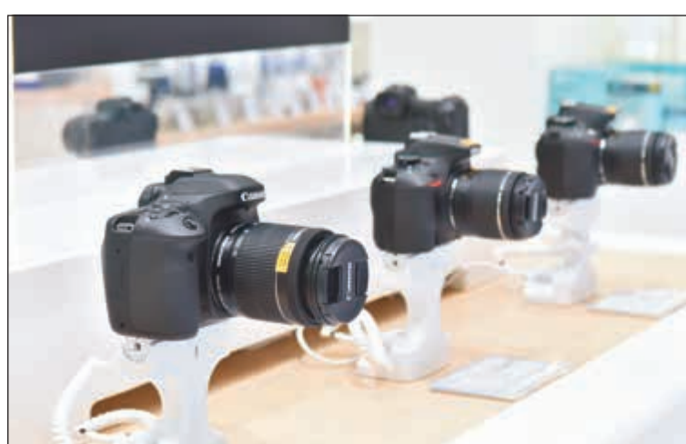
كاميرات تصوير متميزة