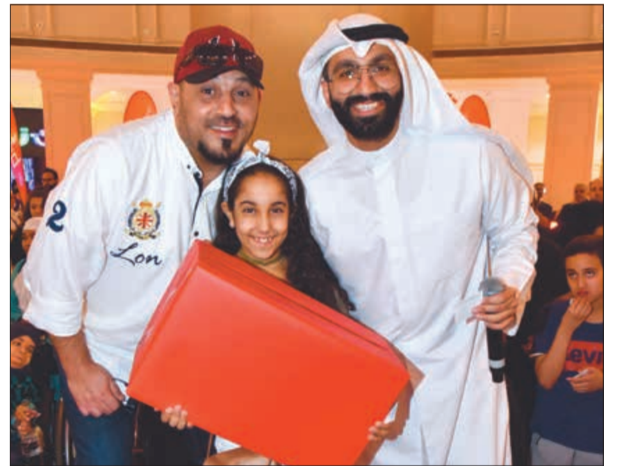
جوائز للفائزين بمسابقات الحفل