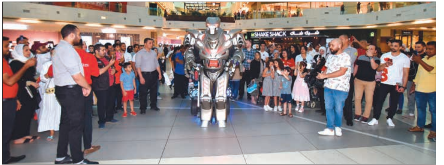
حضور كبير في حفل افتتاح بست اليوسفي في «الأقنيوز».. ومتابعة لفكرة «الروبوت»