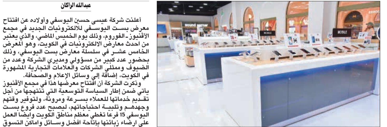
أجهزة من جميع العلامات المميزة