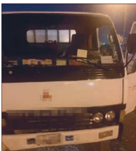
أحدى المركبات المخالفة