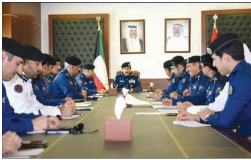
الفريق خالد المكراد خلال ترؤسه اجتماعاً موسعاً لقيادات الإطفاء

طالبهم بتكثيف الحملات التفتيشية عقب حريق المهبولة