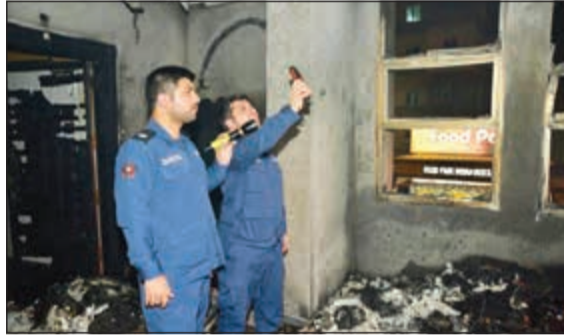
رجلا إطفاء يوثقان التجاوزات الجسيمة لحريق المهبولة

شدد مدير عام الإدارة العامة للإطفاء العامة والإعلام المكراد على عدم التهاون في تطبيق العقوبات على المخالفين، وخصوصاً في العمارات الاستثمارية والمجمعات التجارية وغيرهما من منشآت، كان ذلك في اجتماع عقد أمس الأحد بحضور نائب المدير العام لقطاع مكافحة الحرائق والوقاية