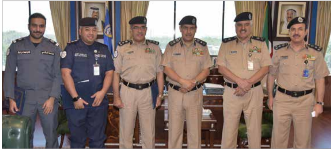
الفريق عصام النهام متوسلاً للمكرمين بحضور اللواء منصور العوضي

حيهم لوطنهم الغالي ويحافظ على الأداء الأمسي الفاعل لمحاربة الجريمة والتصدي لها بكل حزم.