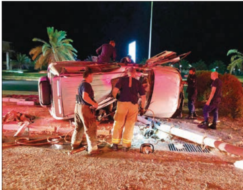
من حادث انقلاب مركبة على طريق التعاون