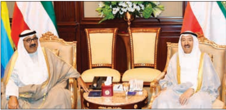
سمو الأمير مستقبلاً الشيخ ناصر صباح الاحمد