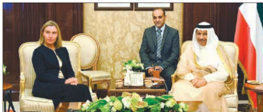
سمو رئيس الوزراء الشيخ جابر المبارك مستقبلاً فديريكا موغيريني

الأوروبي في الكويت». وتوجهت بالشكر إلى صاحب السمو على حسن الضيافة والتعاون والاستقبال قائلة «لقد استقبلني صاحب السمو خلال زيارتي الثالثة هنا في الكويت حيث تم تناول سبل التعاون الثنائي المثمر بين الكويت والاتحاد الأوروبي والمنطقة». وبيّنت «لقد افتتحنا مقر بعثة الاتحاد الأوروبي في مدينة الكويت الذي سيساعدنا على زيادة وتعميق تعاوننا في مختلف القطاعات إلى جانب بحث الأوضاع في المنطقة». وأشارت إلى أهمية وجود مقر لبعثة الاتحاد الأوروبي في الكويت والذي يعد ثمرة الصداقة الجيدة التي تربط الطرفين. من جانبه، استقبل سمو الشيخ جابر المبارك رئيس مجلس الوزراء وبحضور نائب رئيس مجلس الوزراء ووزير الخارجية الشيخ صباح الخالد، الممثل الأعلى للشؤون