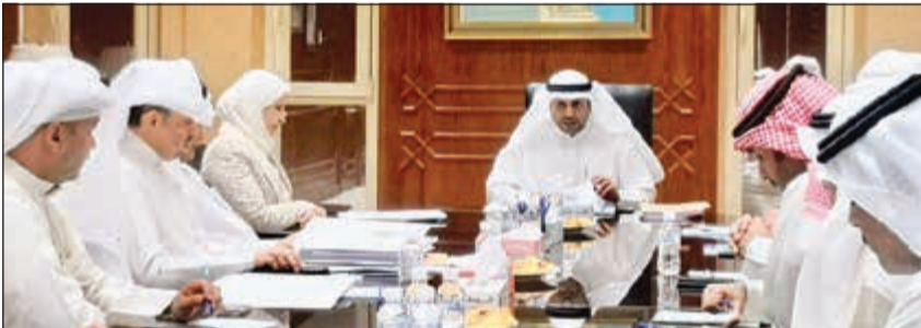
وزير الإعلام ووزير الدولة لشؤون الشباب خلال اجتماعه مع قيادات الإعلام

وحماية المال العام. وكما شدد وزير الإعلام ووزير الدولة لشؤون الشباب على جدية متابعة أي تأخير ومساعدة المتسببين فيه أياً كانت مراكزهم.