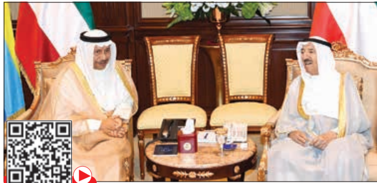
صاحب السمو الأمير الشيخ صباح الأحمد مستقبلاً سمو الشيخ جابر المبارك