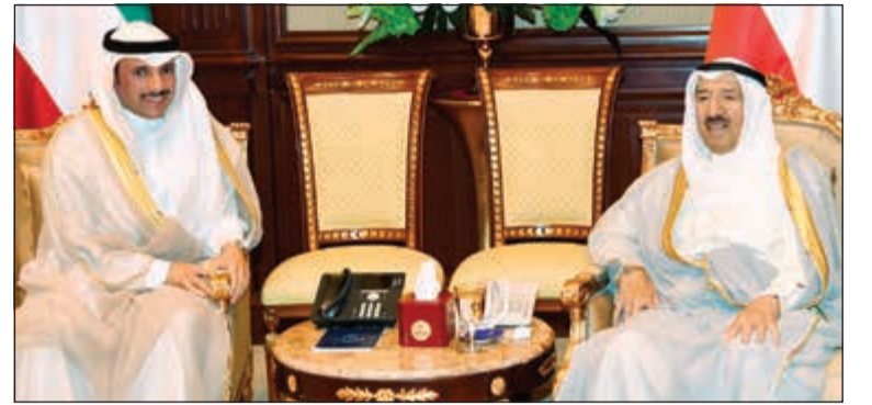
صاحب السمو الأمير الشيخ صباح الأحمد مستقبلاً مرزوق الغانم