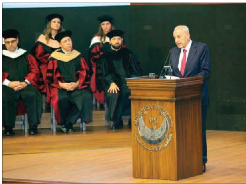
رئيس مجلس النواب نبيه بري خلال رعايته حفلاً لتخرج الأول طلاب جامعة فينيسيا