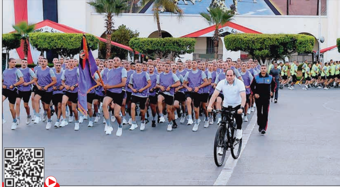
القاهرة - خديجة حمودة

قام الرئيس عبدالفتاح السيسي فجر أمس بزيارة تفقدية للكلية الحربية، حيث تابع برامج التدريب اليومية لرفع الكفاءة البدنية وكذلك الإعداد المهاري لطلبة الكلية، وذلك بحضور الفريق أول محمد زكي وزير الدفاع والفريق محمد فريد رئيس أركان حرب القوات المسلحة. وصرح المتحدث الرسمي باسم رئاسة الجمهورية السفير بسام راضي، بأن الرئيس السيسي شارك طلبة الكلية الحربية نشاطاً الرياضي فجراً، كما تحدث خلال الجولة مع طلبة الكلية الحربية، مؤكداً أن التدريبات تعد إحدى أهم الركائز في بناء ضباط وقادة المستقبل داخل القوات المسلحة وتنمية قدرتهم على تنفيذ المهام الموكلة إليهم لحماية الوطن والحفاظ على أمنه واستقراره ومقدراته، كما يؤكد في هذا