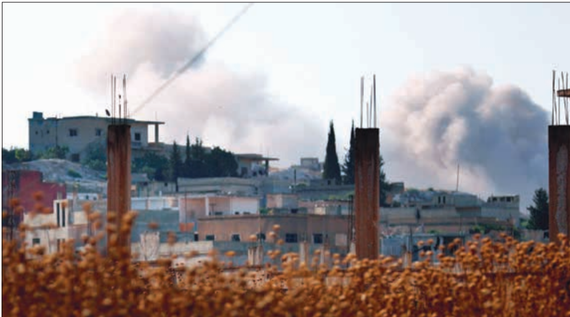
الدخان المتصاعد من بلدة الحماميات خلال الاشتباكات بين الجيش السوري والمعارضة أمس

الجيش السوري تصدت أمس، لهجوم مسلح على منطقة (الحماميات) بريف حماة شمالي غرب البلاد. وأفادت أن المسلحين قصفوا بشكل كثيف مواقع للقوات الحكومية السورية في منطقة الحماميات وكفر هود والجملة وشيخ حديد وكرنان في ريف حماة شمالي وشمالي غرب سورية.