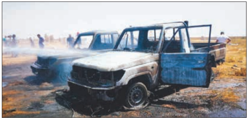
سيارات محترقة جراء الانفجارات في بنغازي أمس

عواصم - وكالات: لقي 3 أشخاص على الأقل مصرعهم وأصيب أكثر من 15 آخرين جراء تفجير بمقبرة الهواري ببنغازي شرقي ليبيا، خلال مراسم جنازة اللواء خليفة المسماري القائد السابق لقوات الصاعقة التابعة للمشير المتقاعد حفر، حسب وسائل إعلام محلية. ونقلت وسائل إعلام عن أحمد المسماري، الناطق باسم قوات حفر، أن 3 انفجارات وقعت في مقبرة الهواري، أثناء تشييع جنازة اللواء خليفة المسماري. وأضاف المتحدث العسكري، أن التفجيرات كانت قريبة من القبر، ونفذت عبر عملية مدروسة، لافتاً إلى أن التفجيرات تمت باستعمال حقائب مفخخة، وأسفرت عن مقتل مدنيين بينهم أطفال، ونقلت وسائل إعلام محلية، نجاة ونيس