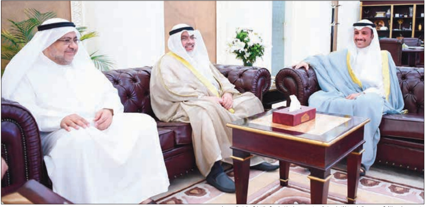
رئيس مجلس الأمة مرزوق الغانم خلال استقباله رئيس ديوان المحاسبة بالإتابة عادل الصرعاوي

استقبل رئيس مجلس الأمة مرزوق الغانم مكتبه أمس رئيس ديوان المحاسبة بالإتابة عادل عبدالعزيز الصرعاوي الذي قدم للغانم التقرير النهائي لمشروع دعم نظم الرقابة الداخلية في