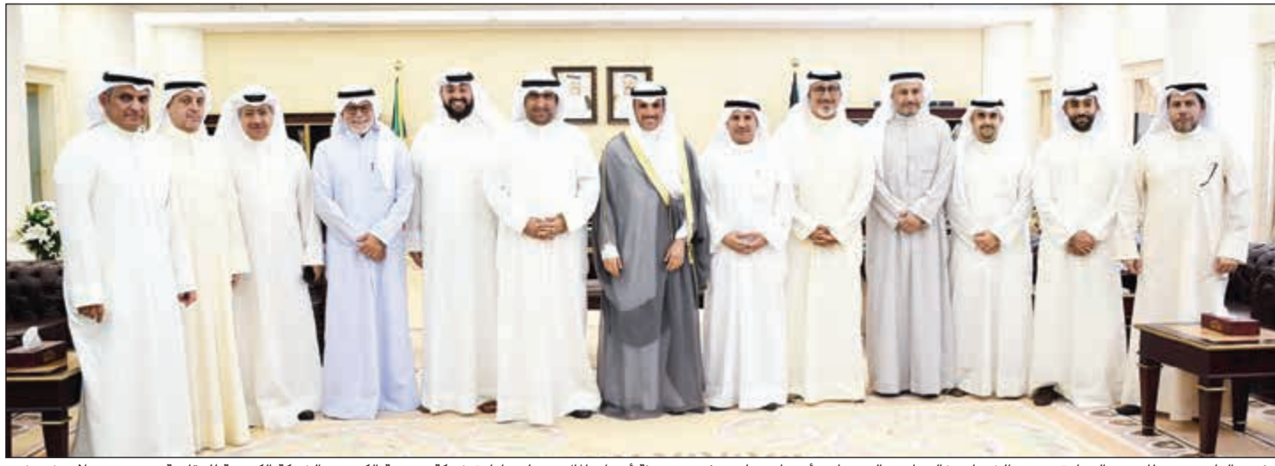
الرئيس الغانم متوسلاً وزير التجارة ووزير الخدمات خالد ناصر الروضان وأعضاء مجلس مفوضي هيئة أسواق المال ومجلس إدارة شركة بورصة الكويت والشركة الكويتية للمقاصة بحضور صلاح خورشيد