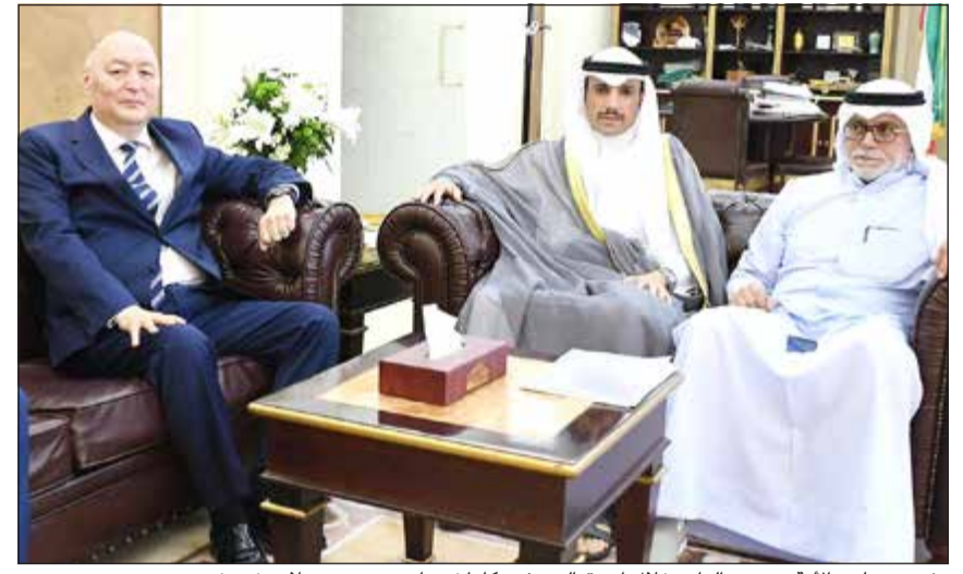
رئيس مجلس الأمة مرزوق الغانم خلال استقباله سفير كازاخستان بحضور صلاح خورشيد