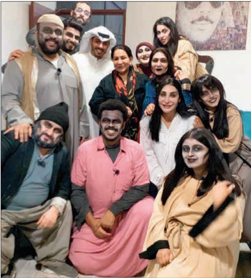
فريق مسرحية «موجب»