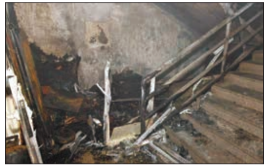
آثار الحريق في السلم