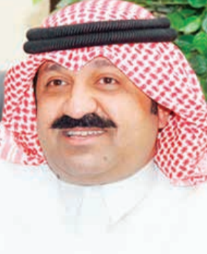
الشيخ أحمد اليوسف