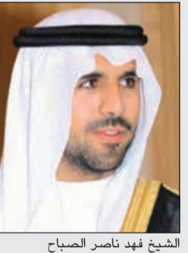
الشيخ فهد ناصر الصباح

دعا رئيس مجلس إدارة اللجنة الأولمبية الكويتية الشيخ فهد ناصر الصباح أبناء الكويت الرياضيين للعمل والعطاء بجد وإخلاص لوضع الرياضة الكويتية على خريطة العالم الرياضية وتحقيق إنجازات تسجل باسم الكويت في المحافل القارية والدولية «لأن ذلك الهدف الأسمى الذي نسعى إليه جميعاً».