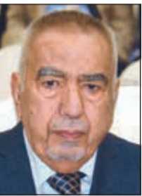
الراحل د.عبدالرحمن العوضي

فقدت الكويت أمس السبت وزير الصحة ووزير التخطيط وعضو مجلس الأمة الأسبق د.عبدالرحمن العوضي عن عمر يناهز 83 عاماً، حيث شهدت البلاد تطوراً كبيراً في القطاع الصحي أثناء توليه الوزارة. الراحل د.عبدالرحمن العوضي خدم بلده الكويت في شتى المجالات والقطاعات، إذ عمل طبيباً مقيماً في وزارة الصحة بين 1963 و1965. وكان قد شغل منصب المدير المساعد لإدارة الخدمات الوقائية في وزارة الصحة عام 1969 ومنصب الوكيل المساعد للخدمات الوقائية من 1970 حتى 1975. ودخل الراحل معترك السياسة منذ عام 1975 عندما اختير عضواً في مجلس الأمة من عام 1975 حتى 1980 واختير وزيراً للصحة من عام 1975 حتى 1983. كما شغل منصب وزير الصحة ووزير التخطيط من عام 1983 حتى 1986 ووزير التخطيط من عام 1988 حتى 1990 ووزير الدولة لشؤون مجلس الوزراء عامي 1990 و1991. وخلال وجوده في وزارة الصحة لأكثر من عشر سنوات شهدت الكويت نهضة صحية شاملة، حيث بنيت أغلب المستشفيات وتطورت البعثة الطبية للحج، وترأس الفقيد رابطة الصداقة الكويتية - الإيرانية، حيث أثمرت جهوده تعزيز العلاقات الأخوية بين الشعبين والدولتين. وبهذه المناسبة الحزينة تتقدم «الأنباء» بآحار التعازي وأصدق المواساة إلى أهل الراحل، سائلين المولى عز وجل أن يتغمده بواسع رحمته ويلهم ذويه الصبر والسلوان. (إنا لله وإنا إليه راجعون).