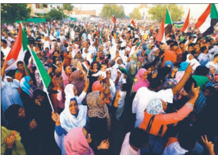
احتفالات في شوارع الخرطوم بالاتفاق بين المعارضة والمجلس العسكري الحاكم

عواصم - وكالات: وسط ترحيب عربي وغربي بالانفراجة التي شهدتها الأزمة السودانية بعد اتفاق المعارضة والمجلس العسكري الانتقالي على تقاسم السلطة، أصدر «تجمع المهنيين» السودانيون الجدول الزمني لها وصفه بـ «خطة العمل» لإشراك جميع الفعاليات في قيادة المرحلة الانتقالية. وفيما يسود الترقب لإمكانية تطبيقه على أرض الواقع فعلياً، أشاد مجلس التعاون الخليجي، ومنظمة التعاون الإسلامي والاتحاد الأوروبي، والعديد من الدول العربية والغربية، باتفاق المجلس العسكري وتحالف قوى الحرية والتغيير الذي يقود المعارضة، على أن تكون عضوية «المجلس السيادي» مناصفة بين الجانبين لمدة ثلاثة أعوام يعقبها إجراء انتخابات، في تطور دفع الآلاف للخروج إلى الشوارع للاحتفال بالخطوة الأولى نحو إنهاء عقود من الديكتاتورية. التفاصيل ص 31