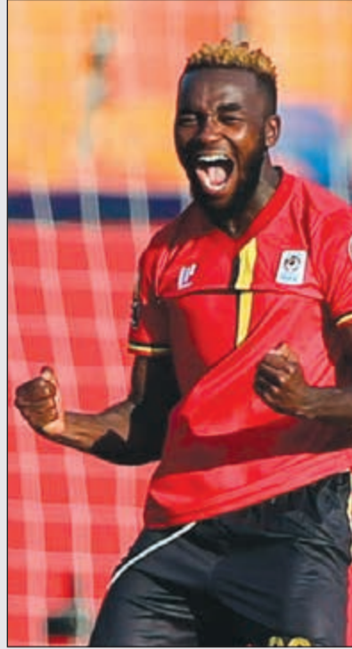
المجموعات للمرة الأولى في تاريخها، متأهلا عن المجموعة السادسة التي ضمت الكاميرون وغانا وغينيا بيساو، حيث قال

تنطلق اليوم منافسات الدور ثمن النهائي، بمواجهتي المغرب مع بنين، والسنغال وأوغندا في مباراتين تحتضنهما مدينة القاهرة. وفي حال تمكن «أسود الأطلس» و«أسود التيرانغا» من عبور العتبة الأولى في الأدوار الإقصائية للبطولة، سيكون المشجعون على موعد مرتقب في ربع النهائي بنهائي مثير بين منتخبين يعدان من أبرز المرشحين لنيل لقب النسخة الـ 32 للبطولة، والذي سيكون الثاني في تاريخ المغرب والأول بعد 1976، واللقب الأول في تاريخ السنغال. المغرب كان أحد أفضل المنتخبات إحصائيا في دور المجموعات، على رغم أنه خاض منافسات المجموعة الرابعة التي ضمت كوت ديفوار وجنوب أفريقيا وناميبيا، والتي أكسبتها صعوبة مصطلح «مجموعة الموت»، ففريق المدرب الفرنسي هيرفيه رونار هو أحد 4 منتخبات لم تتلق شباها أي هدف في الدور الأول، مع مصر والجزائر والكاميرون كما حصد العلامة الكاملة من 3 انتصارات، لكنه اكتفى بتسجيل هدف واحد في كل مباراة واحتاج الى اللحظات القاتلة لحسم مباراتي ناميبيا وجنوب أفريقيا، وبينهما أداء متمكن ضد منتخب كوت ديفوار.