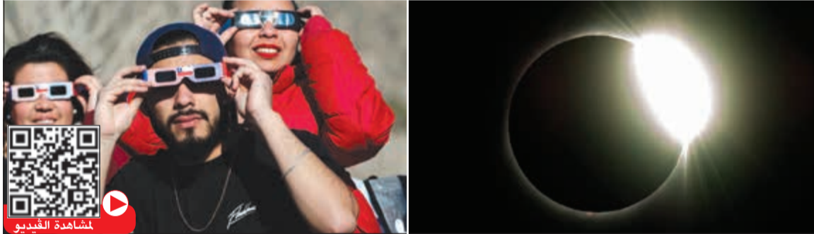
صورة مجمعة لمراحل كسوف الشمس في سماء تشيلي ومتابعون للظاهرة الفلكية

أ.ف.ب: شهد شمال تشيلي كسوف كليا للشمس أغرق المنطقة في ظلمة دامسة لمدة دقيقتين و36 ثانية في خضم النهار، في ظاهرة فلكية تسنت رؤيتها أيضا في الأرجنتين وجزء كبير من منطقة المحيط الهادئ. وبدأت هذه الظاهرة في المحيط الهادئ أول من أمس عند الساعة 13,01 (17,01 بتوقيت غرينيتش) قبل أن يشمل نطاق الظلام الكلي الممتد على أكثر من 150 كيلومترا السواحل الشمالية لتشيلي عند الساعة 16,38 (20,38 بتوقيت غرينيتش) ثم يبلغ وسط الأرجنتين قبل أن ينحل في المحيط الأطلسي. وقد تسلسل القمر بين الشمس والأرض، فحلت ظلمة دامسة لأكثر من دقيقتين على المنطقة في خضم النهار، بحسب ما أفاد مراسلو وكالة «فرانس برس»، في حين كانت السماء صافية من الغيوم في شمال البلاد.