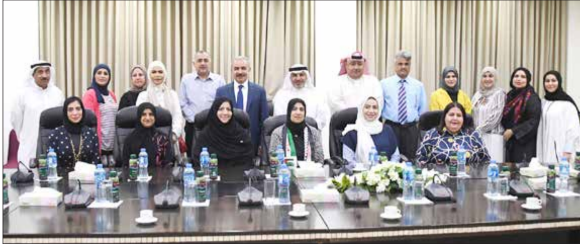
رئيس الوزراء الفلسطيني محمد اشتية مع وفد الغيصة وأعضاء وفد وزارة التربية

الرئيس عباس: المعلم الفلسطيني الذي سيذهب للعمل في الكويت سيكون جسراً لتعزيز العلاقات الأخوية اشتيه: نشكر الكويت أميراً وحكومة وشعباً على موقفها النبيل والشجاع بعدم ذهابها ومشاركتها في ورشة المنامة