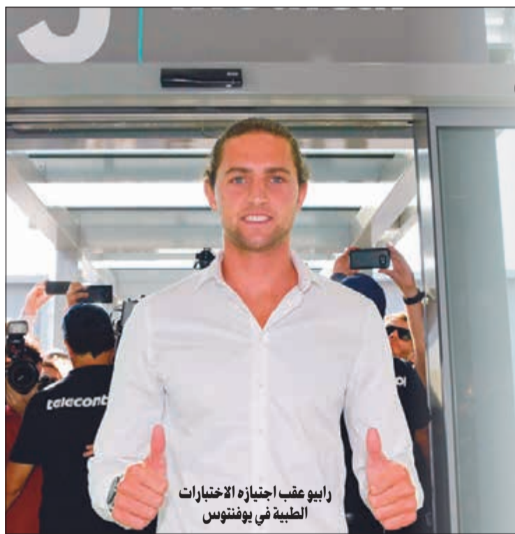
رابيو عقب اجتيازه الاختبارات الطبية في يوفنتوس

أعماله، نجح في اجتياز الفحص الطبي ووقع عقدا يمنحه راتبا مقدرا بـ7 ملايين يورو سنويا. مع قدوم رابيو، أثبت يوفنتوس أنه بطل الصفقات المجانية، بعد تعاقد في السنوات الأخيرة مع أمثال بوغبا، بيرلو، كومان، خضيرة، داني ألفيس أو رامسي القادم أخيرا.