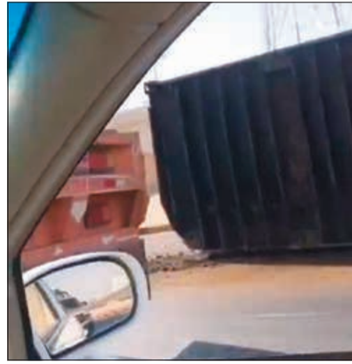
الكوتنيزرات بعد انقلابها