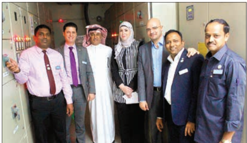
جانب من مشاركة «سفير الفنتاس» في فعاليات ساعة الترشيد

فعالة ومستمرة للحد من استهلاك الطاقة من خلال الابتكار والعمل الجماعي والبرامج البيئية التي تستهدف البدائل الجديدة الموفرة للطاقة بالتنسيق مع الضيوف والعلاء لخدمة البيئة والمجتمع وأهداف الشركة. وفندق سفير الفنتاس ذو الخمس نجوم والذي يقع بالفنتاس المكان المناسب لرجال الأعمال والسياح، بما يقدمه من نشاطات وخدمات وتسهيلات متنوعة. ويستطيع الضيوف الاختيار من بين 150 غرفة وجناح إلى شقق سكنية مجهزة، غرفة أو غرفتي نوم، يوفر فندق سفير الفنتاس الكويت متعة العيش الجميل والناظر المذهلة والفاخرة للمدينة والخليج العربي. وسائل الراحة، بالإضافة إلى مركز مجهز للرياضة وقضاء وقت الفراغ، ووجود العديد من المطاعم والمقاهي النموزجية كل ذلك يجتمع ليشكل واحة من السحر الذي لا يقاوم في الكويت.