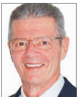
الشركة العملية للفنادق.. ريادة في مجال الضيافة