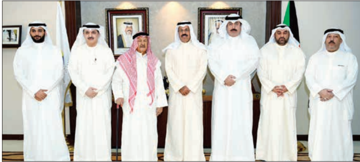
الشيخ أحمد النواف متوسطاً مختاري الرميثية وسلوى ورؤساء الجمعيات التعاونية

أشاد محافظ حولي الشيخ أحمد النواف بنجاح العمل التعاوني في البلاد من خلال الخدمات التي توفرها الجمعيات للمواطنين والمقيمين والدعم اللامحدود للارتقاء به.