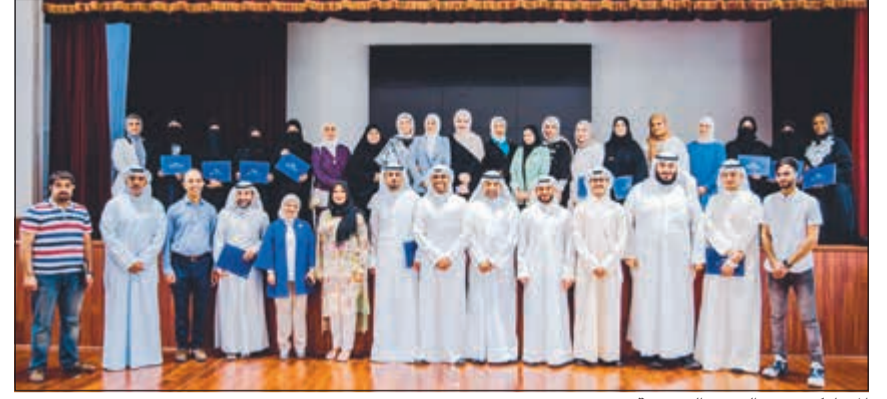
المشاركين في الدورة التدريبية

البناء مع وزارة التربية لتطوير الأداء المهني للمعلمين واستحداث محتويات دراسية إثرائية، لتقديم مقررات ومفاهيم جديدة تتفق مع عصر اقتصاديات المعرفة، وبما يخدم خطط الارتقاء بالعملية التعليمية لتتواءم مع رؤية الكويت 2035. وقال د.السويد ان المركز الذي يسعى إلى توطين التعاون مع مختلف الوزارات والجهات البحثية والعلمية محلياً وعربياً وعالمياً، قام مؤخراً بعقد دورة تدريبية استفاد منها 30 موجهاً ومعلماً لتمكينهم من إعداد وتقديم محتويات دراسية عالية الجودة. وأوضح ان المركز يمثل هذه الدورات والبرامج يوفر عملة نادرة من الموجهين والمعلمين القادرين على كتابة وبناء محتويات تدريسية للطلبة في مختلف المواد الأساسية.