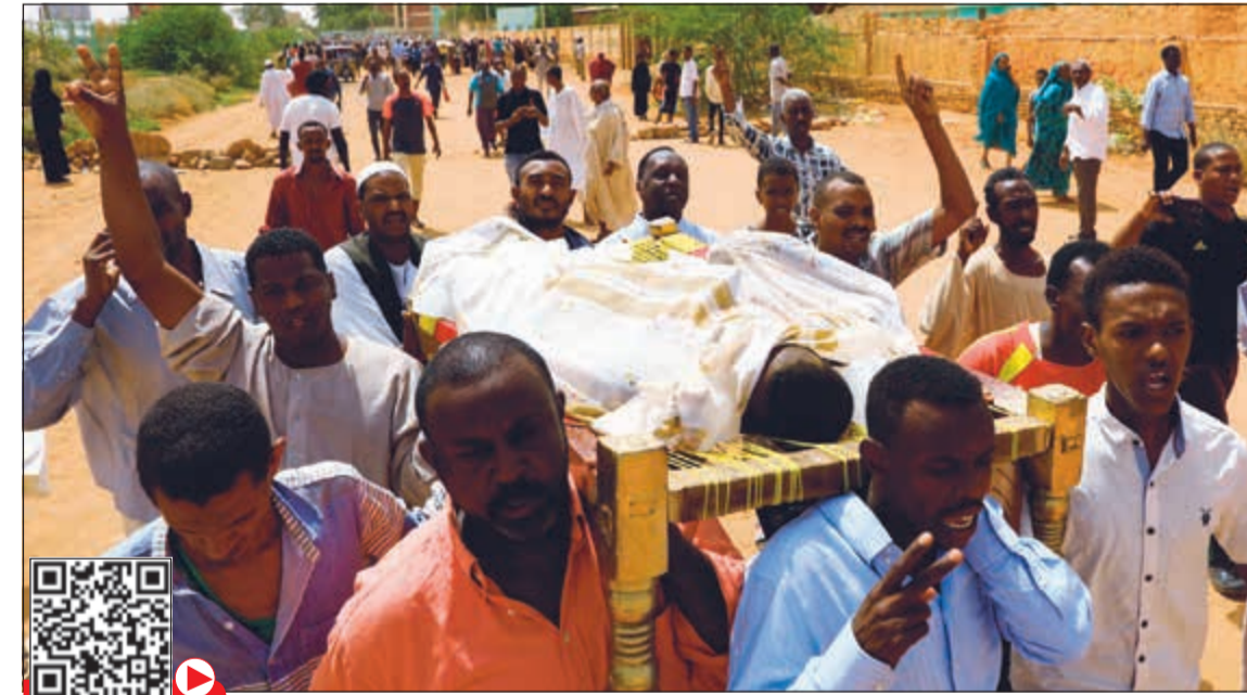
سودانيون يحملون جثمان أحد القتلى الثلاثة في أم درمان امس

الإرهابيين وذلك من أجل قوات شرق ليبيا بقيادة المشير خليفة حفتر عملية عسكرية جوية ضد أهداف تابعة لحكومة الوفاق الوطني المعترف بها دولياً في العاصمة طرابلس، بحسب ما ذكرت تقارير إعلامية ليبية. ونقلت صحيفة (المرصد) الليبية عن أمر غرفة عمليات سلاح الجو بالقيادة العامة للقوات المسلحة اللواء محمد منقر قوله في بيان «تهيب بكل أهلنا في طرابلس الإفرج عنهم و«قرروا طوعاً أو إكراهاً» فوراً عن المواقع العسكرية ومواقع الميليشيات