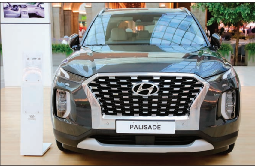
المصابيح الأمامية المركبة ذات الإنارة العمودية تتصل بشكل أنيق بالشبك الكبير ذي الفتحات متوالية الانحدار

وتطرح «شمال الخليج» بشكل دوري باقة متجددة من العروض التجارية بهدف إرضاء العملاء ومنحهم فرصة لامتلأ هونداي بأسعار مميزة وأقساط سهلة، ويهدف المساهمة في تعزيز صورة وسعة «هيونداي» كسيارة ناجحة وعلامة تجارية استطاعت بوقت قصير منافسة أقدم شركات السيارات وأكثرها عراقية، ووفاء لفلسفة «هيونداي» التي تضع حاجات العملاء على رأس قائمة أولوياتها سواء قبل البيع أو بعده.