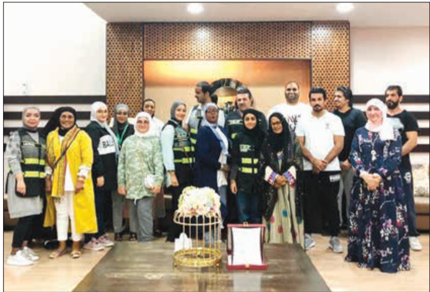
جانب من زيارة مركز فرح في دار المسنين

تقديرًا لمكانة المسنين وللدور الذي قدموه خلال مسيرة حياتهم، قامت مجموعة «ابتسم أنت تستطيع» (smile, you can do it) التطوعية بزيارة إلى «مركز فرح» في دار المسنين لتخللها الحديث الممتع مع كبار السن وتقديم بعض الهدايا الرمزية لهم. وقد أبدى أعضاء المجموعة المشاركين في الزيارة سعادتهم بالاستفادة الكبيرة من هذه المبادرة، متمنين أن تستمر مثل هذه الزيارات في المستقبل لما لها من أثر طيب في نفوس الجميع، وبما يرسخ معاني الاحترام والتقدير لهذه الفئة من أهلنا.