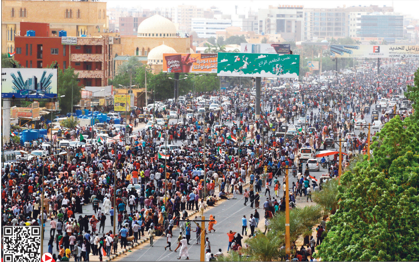
احتجاجات واسعة في العاصمة الخرطوم أمس