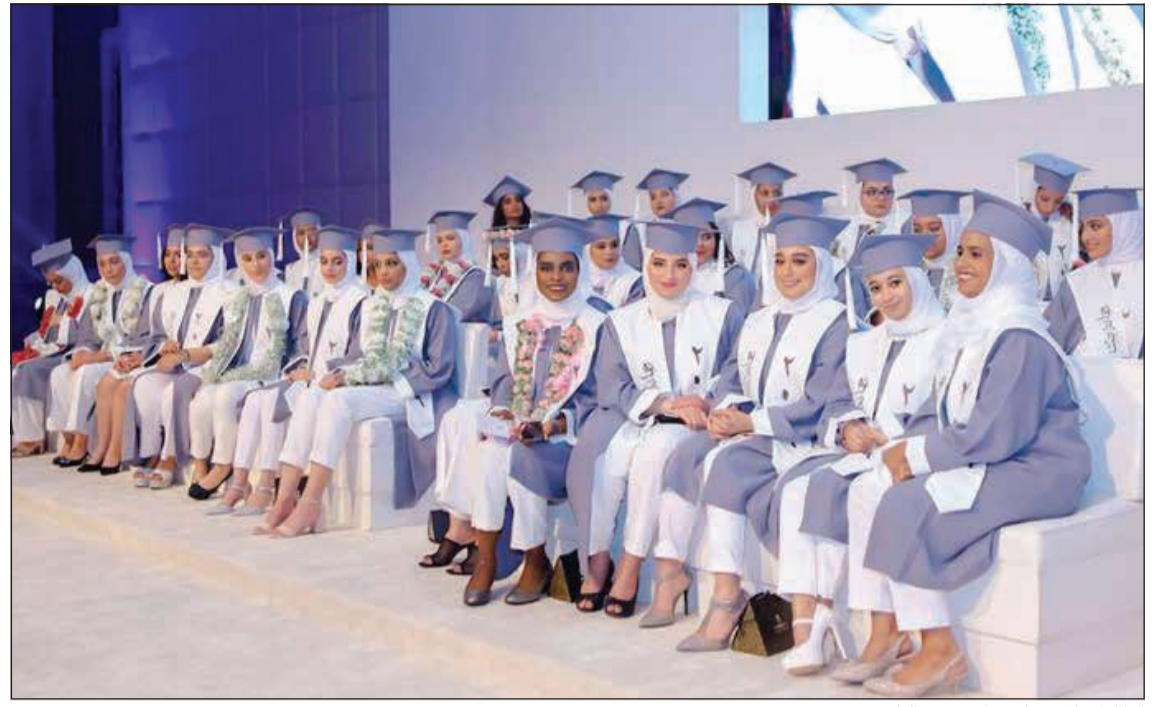
الطالبات المتفوقات خلال حفل التكريم