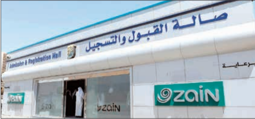
صالة القبول والتسجيل بحلتها الجديدة

دور القطاع الخاص في دعم المنظومة التعليمية وتبني مستقبل الشباب الكويتي، حيث تعتمد من خلال مشاركتها ودعمها للعديد من الفعاليات التعليمية كالمعارض الوظيفية على جذب الكفاءات الوطنية القادرة على إثراء ألية ومنظومة العمل، فالشركة تؤكد أهمية قطاع التعليم، وتعتبره من القطاعات المهمة التي تلعب دوراً محورياً في مسيرة التنمية.