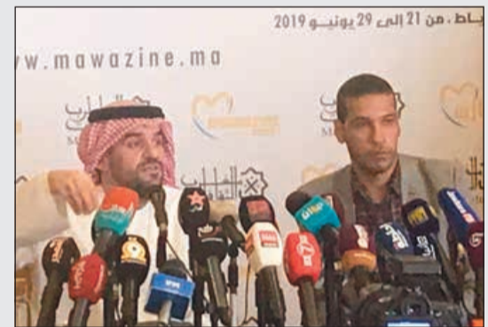
حسن الجسمي في المؤتمر

وردا على سؤال حول نية ربما الرجائي ملاحقة كل من يغني لوالدتها السيدة فيروز في حفلاته دون الحصول على إذن رسمي، وكونه المعنى المباشر بهذا القرار إذ يخص «السفيرة إلى النجوم» بوحدة من أغنياتها على الأقل في حفلاته، قال: «أحب فيروز، ورح ضل حب لبنان لتخلص الدني». وخلافا لبقية الفنانين، لم يغادر الجسمي القاعة من الباب الخاص، بل عبر إلى حيث الإعلاميين والتقط الصور معهم.