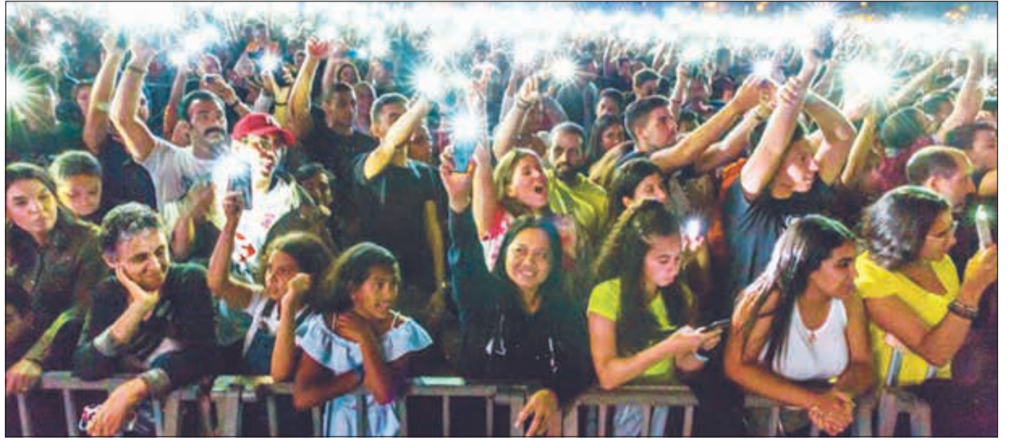
جمهور «موازين» نجم الحفلات