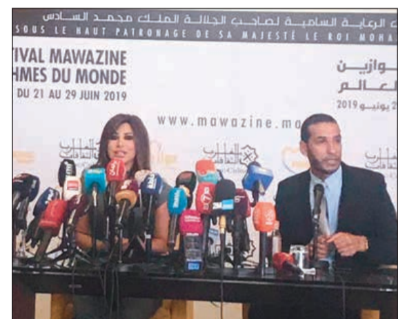
نجوى كرم في المؤتمر الصحافي