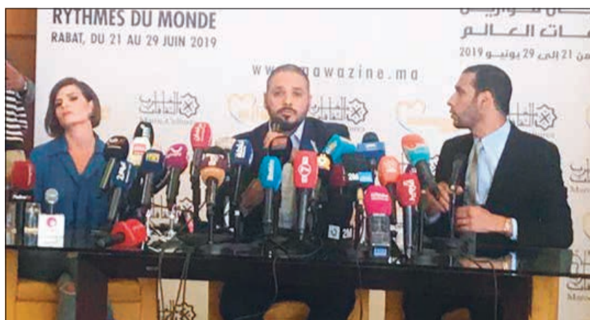
جانب من مؤتمر رامي عياش