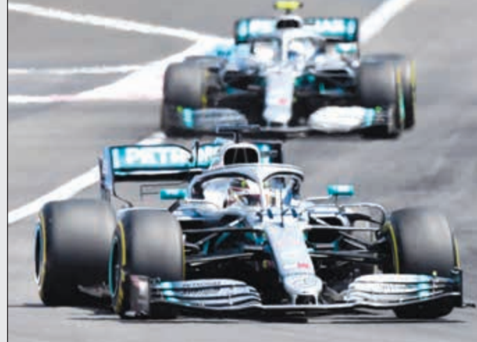
لويس هاميلتون يقود فريق «مرسيدس»

تذكيرا قاسيا للسرعة التي يمكن أن تتبدل فيها الأمور بالاتجاه الخاطئ في رياضة، وأن الوثوقية والأداء مكملا لبعضهما البعض في الفورمولا واحد، وأثبتت حظيرة الألمانية في مونتريال ولو كاستيليه أنها تملك الحلول والقدرات لتجاوز هذه المطبات، وبرهنت مرة جديدة أن قدرها لا يتعلق فقط بسائقها هاميلتون على الحلبة. بل بتوليعة متماسكة قادت الفريق لأن يتوج بطلا للصاعين والسائقين في الأعوام الـ 5 الأخيرة، وتحديدًا منذ عام 2014 وبداية حقبة محركات الـ «في 6» الهايبريد.