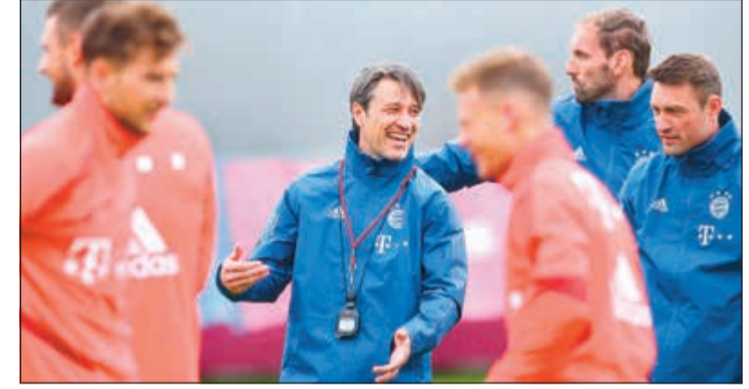
نيكو كوفاتش يسعى لتعزيز صفوف بايرن ميونخ

أكد مدرب بايرن ميونخ بطل ألمانيا، الكرواتي نيكو كوفاتش، أن فريقه في حاجة إلى التعاقد مع 4 لاعبين جدد استعدادا للموسم المقبل بعد رحيل أكثر من لاعب مؤثر عن الفريق في نهاية الموسم المنصرم. وقال كوفاتش في حديث مع مجلة «كيكر» الألمانية: «لا يمكن أن نقوم بعمل جيد برفقة 17 لاعبا فقط، نحتاج إلى 19 على الأقل».