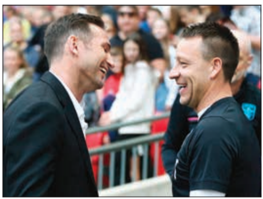
جون تيري وفرانك لامبارد في مناسبة سابقة

توقع المدافع الدولي الإنجليزي السابق جون تيري نجاح مواطنه وزميله السابق في تشلسي فرانك لامبارد في حال تسلم مهمة تدريب بطل مسابقة الدوري الأوروبي «يوروبا ليغ»، بسبب أخلاقياته في العمل وقدرته على النجاح تحت الضغط.