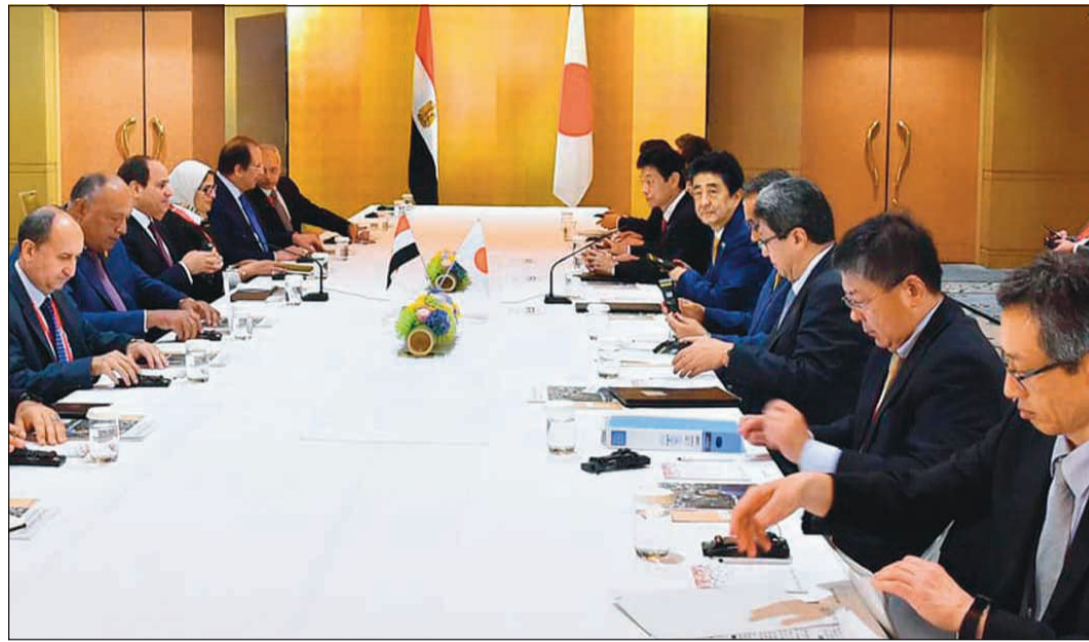
الرئيس عبد الفتاح السيسي يعقد جلسة مباحثات قمة موسعة بمدينة أوساكا مع رئيس وزراء اليابان شينزو آبي

وأضاف محافظ القاهرة في تصريحات له أنه سيتم تخفيض قيمة تذاكر الأتوبيس النهري يوم الأحد القادم 50٪ على كل رحلاته بمناسبة الاحتفالات بذكرى ثورة الثلاثين من يونيو.