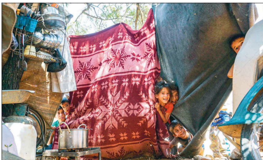
اطفال سوريون في خيام صنعت من الاغطية والبطاطين في مخيم مؤقت ببلدة عقربا بريف حلب

الهجوم على قواعد المراقبة التركية في إدلب، فلا يمكن أن نلتزم الصمت وستقوم بما هو مطلوب». كما اعتبر وزير الخارجية