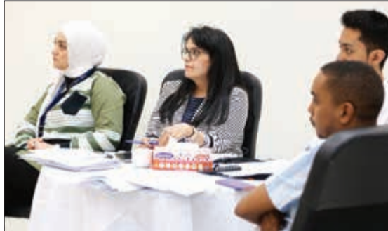
متابعة من الطلبة

حول العملية الكاملة لتحويل الفكرة إلى تقرير فني متماسك مع نتائج واضحة وبناء منطقي. وشملت الدورة منتسبي وخريجي وطلاب الكلية وموظفين من القطاع الخاص.