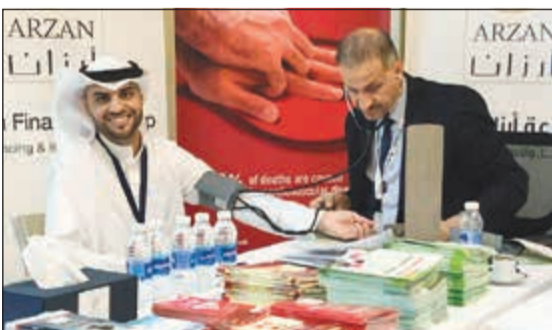
مشاركة مميزة من موظفي «أرزان» في حملة «ساعد»