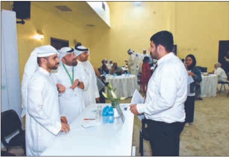
البنك التجاري ورد على استفسارات الحضور