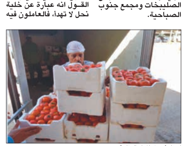
انتقاء أفضل المواد الغذائية

اليومية لكل الفئات بمجمع دور الرعاية الاجتماعية بالصليبيات وكذلك الدور التابعة له ومجمع جنوب الصباحية، ويشمل ذلك النزلاء والمستفيدين. كما يقع على عاتق القسم الإشراف على بوفيهات الحفلات والمناسبات حسب طلب الإدارات المشمولة بالخدمة. وأضاف المطوع أن القسم يشارك كذلك في فعاليات اليوم التوعوي للغذاء كل عام في الصالة المتعددة الأغراض بمجمع دور الرعاية الاجتماعية بالصليبيات، وذلك بحضور القياديين