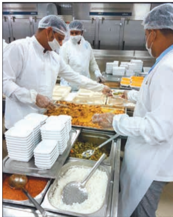
جانب من عملية تجهيز الطعام