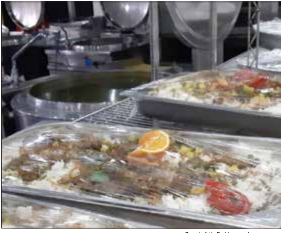
حرص على نظافة الأطعمة