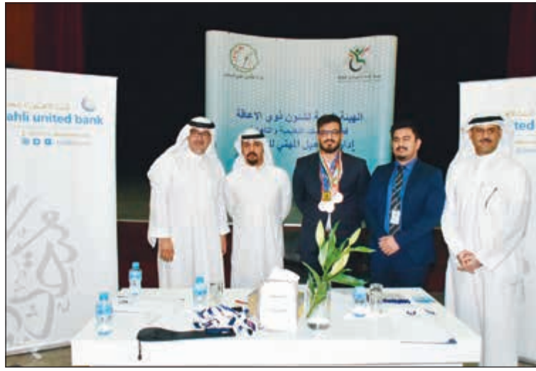
جناح البنك الأهلي المتحد خلال الفعاليات