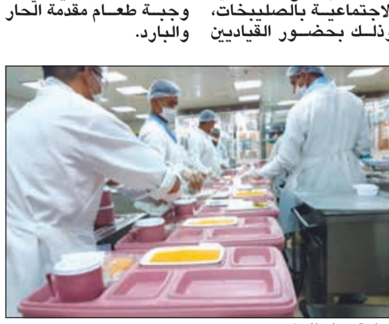
إعداد الوجبات للنزلاء