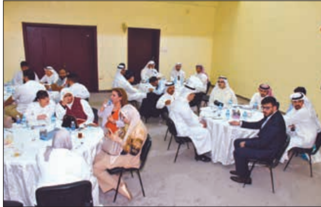
جانب من الحضور والمشاركين في الفعاليات