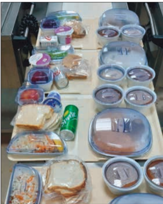
وجبات بعد تغليفها