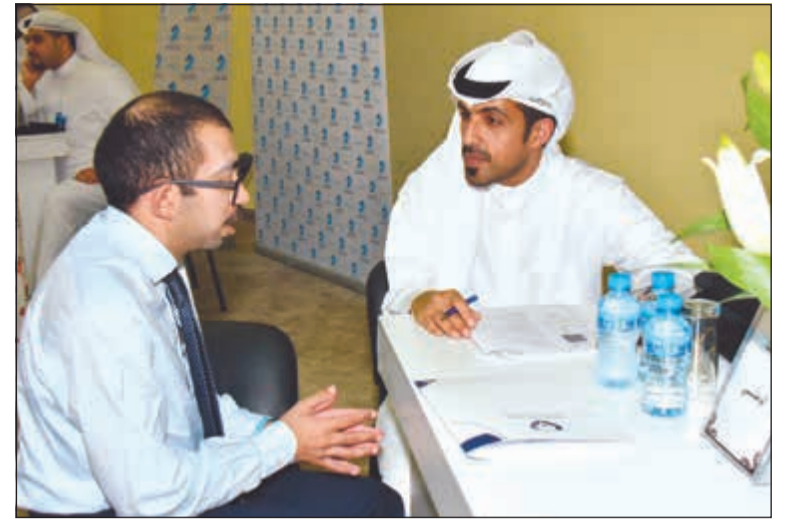
أحد موظفي البنك الوطني مع أحد المتقدمين خلال الزيارة

عدد منها نظم زيارة ميدانية لإدارة التأهيل المهني لشرح الفرص الوظيفية المتاحة للمعاقين في القطاع المصرفي