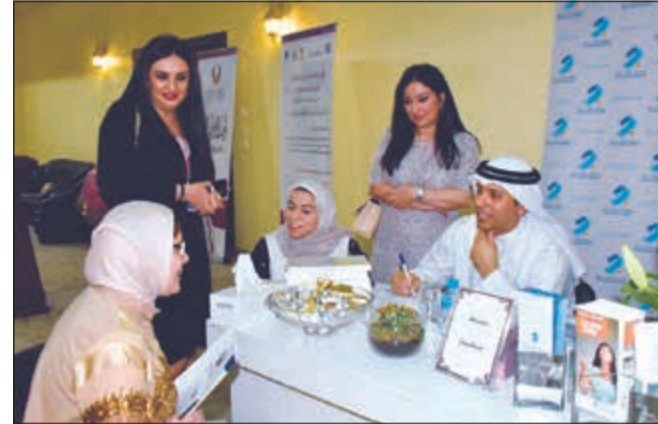
بنك برقان ودعم لذوي الاحتياجات الخاصة