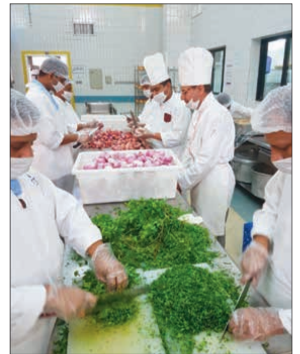
تجهيز الخضراوات اللازمة للمطبخ