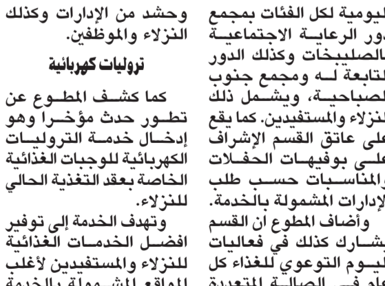
إعداد الوجبات للنزلاء