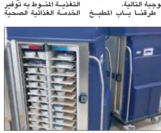
تروليات كهربائية للطعام الحار والبارد