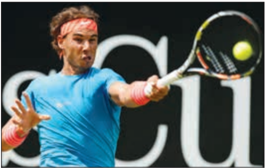
نادال غير راض على تصنيف ويمبلدون

انتقد الإسباني رافايل نادال المصنف الثاني عالميا معيار اختيار المصنفين الأوائل في بطولة ويمبلدون، فائزة البطولات الأربع الكبرى للتنس، والذي يأخذ بعين الاعتبار الإنتاج المحققة على الملاعب العشبية دون «احترام نظام» التصنيف العالمي للاعبين المحترفين، ما يضعه في المركز الثالث خلف المصري نوافك ديوكوفيتش والسويسري روجيه فيدرر. وصرح نادال خلال مقابلة بثت على قناة «موفيستار» الإسبانية «الشيء الوحيد في هذه المسألة، الذي لا يبدو جيدا بالنسبة لي، هو أن بطولة ويمبلدون هي الوحيدة التي تفعل ذلك».