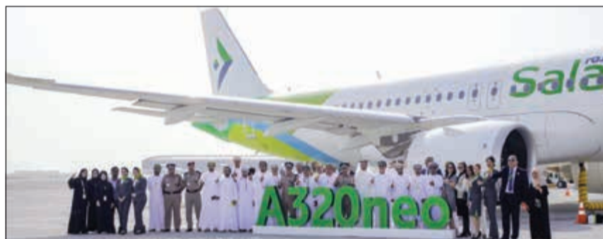
جانب من تسليم الطائرة