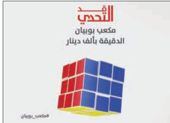
شعار «تحدي مكعب بوبيان»