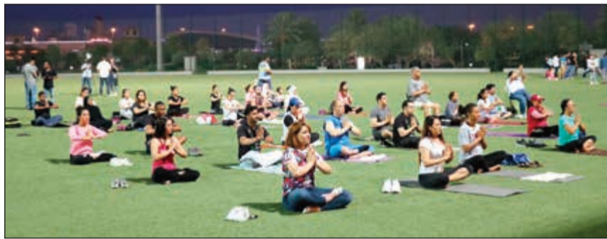
جانب من الاحتفال بيوم الصحة

سيمفوني ستايل وفريق الشركة التجارية العقارية هذه الفرصة للتغوية بأهمية هذه الفعاليات التي تحت إشراف الأسرة على ممارسة الرياضة والاهتمام بصحتهم الجسدية والنفسية، كما دعوا الجميع للمشاركة في الفعاليات القادمة.