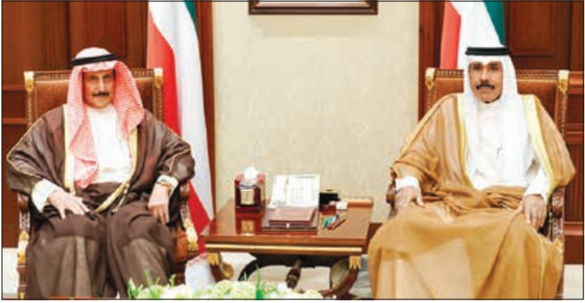
سمو ولي العهد الشيخ نواف الأحمد مستقبلاً الشيخ د.إبراهيم الدعيج

استقبل سمو ولي العهد الشيخ نواف الأحمد بقصر بيان صباح أمس الشيخ د.إبراهيم الدعيج.