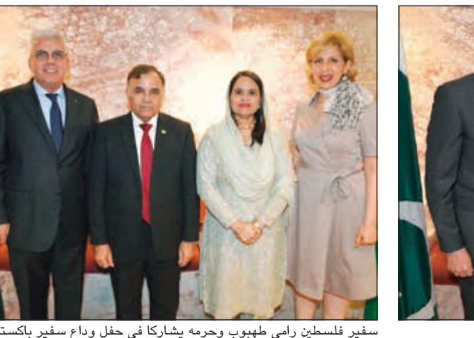
سفير فلسطين رامي طهوب وجرمه يشاركا في حفل وداع سفير باكستان

عدد من الزيارات رفيعة المستوى بين البلدين منها زيارة رئيس وزراء بلاده ووزير الخارجية إلى الكويت، بالإضافة إلى العديد من الوفود العسكرية رفيعة المستوى المرموقة لدعم وتعزيز التعاون العسكري بين البلدين، موضحاً أن وزير خارجية بلاده جدد