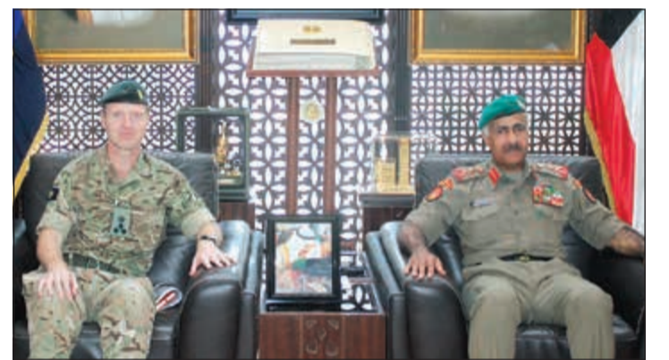
الفريق الركن محمد الخضرب مستقبلاً العميد بيل رايت

بفرع الشؤون الإسلامية والخدمة الاجتماعية بإجراء قرعة لضباط الصف والأفراد المرشحين من قبل وحدات الجيش المختلفة أداء مناسك الحج على نفقة وزارة الدفاع. ويأتي تسير بعثة الحج لهذا العام للمرة العاشرة، بمبادرة من النائب الأول لرئيس مجلس الوزراء ووزير الدفاع لإخوانه وأبنائه منتسبي الجيش الكويتي.