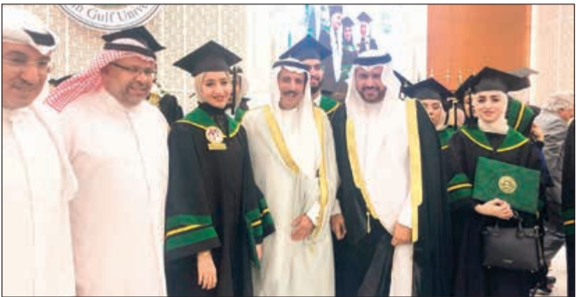
السفير الشيخ عزام الصباح متوسماً عدداً من الخريجين

قال عميد السلك الدبلوماسي سفيرنا لدى مملكة البحرين الشيخ عزام الصباح، إن القيادة السياسية في الكويت تولي طلب العلم جل اهتمامها باعتباره المحرك الأساسي للمسييرة التنموية. وأكد السفير الشيخ عزام الصباح خلال حضوره حفل