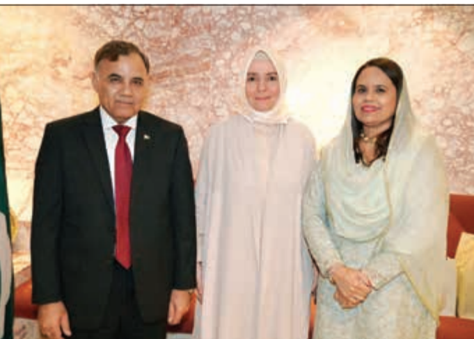
السفيرة التركية عائشة كوتياك مع السفير الباكستاني