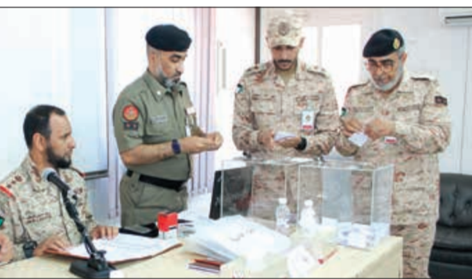
جانب من إجراء قرعة الحج لمنسوبي الجيش