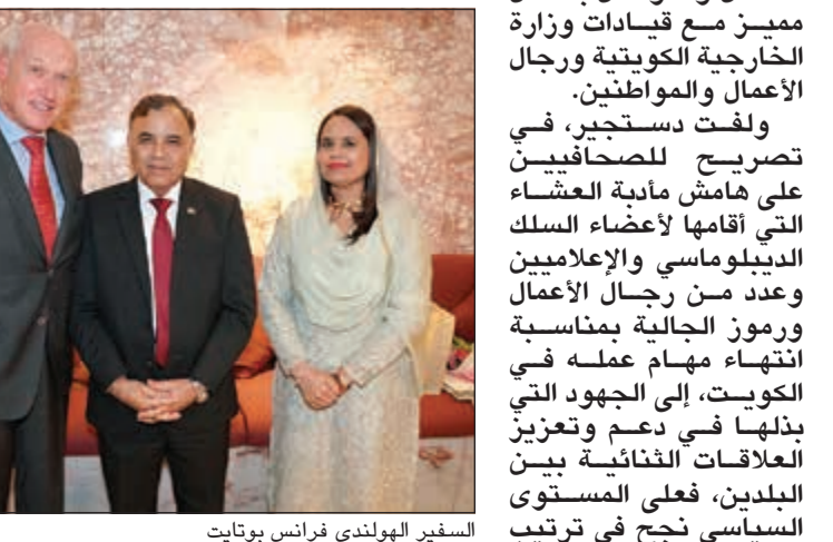
السفير الهولندي فرانس بوتيات