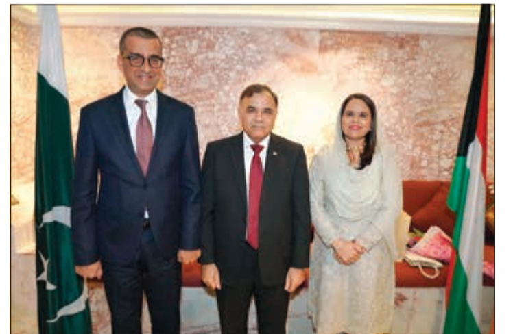
السفير التونسي أحمد بن الصغير مودعا سفير باكستان

وأشار إلى أنه سيغادر الكويت خلال شهر يوليو متوجهاً إلى الإمارات كسفير من قبل الحكومة الإماراتية. وعن موقف باكستان مما يحدث في المنطقة، أوضح أن بلاده ترى أنه لا بد من الحوار لحل المشكلات والأزمات، مؤكداً أن باكستان تحاول نزع فتيل الأزمات ودعم عملية السلام من خلال علاقاتها الطيبة مع مختلف الأطراف المعنية. وأوضح أنه سيفتقد أصدقاءه وثقافة الديوانية الفريدة التي تمتلكها الكويت، داعياً أبناء الجالية لمواصلة مساهماتهم في ازدهار الكويت.