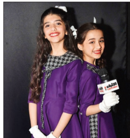
الجود والجوري ومايك «الأنباء»