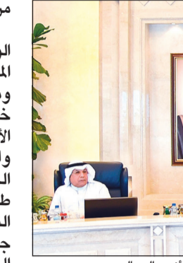
سمو الشيخ جابر المبارك مترأساً الاجتماع بحضور الشيخ ناصر صباح الأحمد والشيخ صباح الخالد والشيخ خالد الجراح وأنس الصباح

الكويت، معرباً عن شكره وتقديره للجهود المتواصلة التي تبذلها وزارة العدل والجهاز القضائي مع الجهود الوطنية والتي أسهمت في حصول الكويت على المكانة المستحقة في مجال مكافحة الاتجار بالبشر والتي تتسجم مع الوجه الحضاري والإنساني الذي تتميز به الكويت وتحرص على تعزيزه. كما بحث مجلس الوزراء شؤون مجلس الأمة، واستعرض مشروعات القوانين التي ستتم مناقشتها في الجلسات القادمة، معرباً عن أمنه في أن يتم إنجاز هذه القوانين بالتعاون مع مجلس الأمة بما يترتب على إقرارها