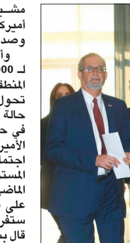
براين هوك والسفير لورانس سيلفرمان قبيل المؤتمر الصحافي

مشيراً إلى أن هناك تحالفاً أميركياً-كويتياً يفخر به وصداقة عميقة في البلدين. وأوضح أن إرسال بلاده لـ 1000 جندي إضافي إلى المنطقة هو رسالة لإيران وإن تحول القوات الأميركية من حالة الدفاع إلى حالة الهجوم في حال تعرضت المصالح الأميركية للتهديد من خلال اجتماعات عسكرية رفيعة المستوى حدثت في الأسبوع الماضي، واكتفى هوك في رده على طبيعة العقوبات التي ستفرضها اليوم على إيران قال بشكل عام سيكون هناك رفع مستوى العقوبات وإن واشنطن لا تعلق عنها قبل موعداً، مشيراً إلى جدوى العقوبات المفروضة حالياً على إيران حيث كانت تهدف إلى منعها من بيع النفط والمعادن والصناعات البترولية مما سيقلل من رقة التهديدات الإيرانية في المنطقة. واستعرض هوك الجهود الدبلوماسية الدولية ومنها زيارة رئيس وزراء اليابان إلى إيران ورفضها كل الجهود الدبلوماسية المبذولة، مشيراً إلى عدم