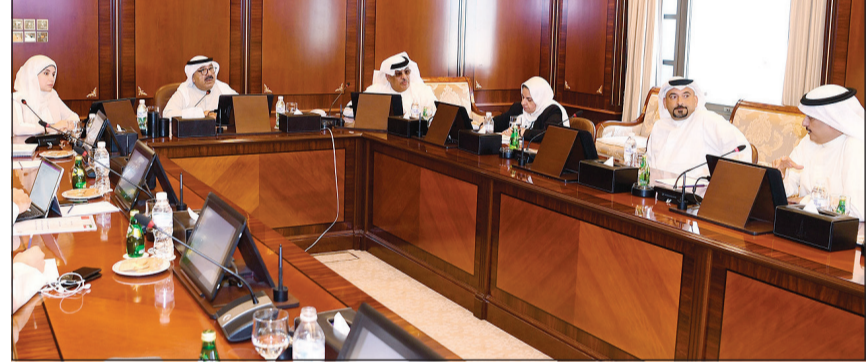
الشيخ ناصر صباح الأحمد ودجنان بوشهري وم.أحمد المنفوشي خلال الاجتماع

مناقشة أهم القضايا والمواضيع ذات الاهتمام المشترك. حضر الاجتماع رئيس لجنة السياسات العامة والإعلام التثميني بالمجلس الأعلى للتخطيط د.فهد الراشد والفريق الفني المرافق له، ومدير عام بلدية الكويت م.أحمد المنفوشي.