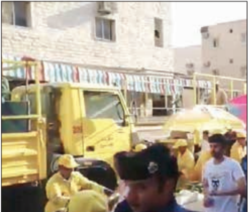
جانب من الأسواق العشوائية في الجليب

في إطار الجهود المتواصلة لتطبيق القوانين واللوائح البلدية والحفاظ على المظاهر الجمالية في مختلف المدن والمناطق، قامت إدارة النظافة العامة وإشغالات الطرق بالفروانية بالتعاون مع وزارة الداخلية بمداخلة 5 أسواق عشوائية في منطقتي جليب الشيوخ والحساوي تم خلالها مصادرة كل المواد الغذائية ورفع المخلفات الناتجة.