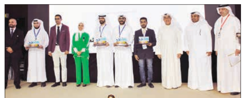
جانب من تكريم الفائزين بالجوائز

أقامت كلية الهندسة والبتترول بجامعة الكويت، ممثلة بمركز التدريب الهندسي والخريجين، حفل ختام معرض التصميم الهندسي 36 والذي عقد تحت رعاية وزير الإعلام ووزير الدولة لشؤون الشباب محمد الجبري وبدعم من مؤسسة الكويت للتقدم العلمي خلال الفترة من 17-18/6/2019، في فندق كروان بلازا - قاعة البركة. وأقيم حفل الختام بتكريم الفائزين بمسابقة أفضل مشروع من الأقسام العلمية المختلفة بكلية الهندسة والبتترول، حيث قدمت مؤسسة الكويت للتقدم العلمي جائزة بقيمة 500 دينار لكل مشروع فائز، بالإضافة إلى جائزة كبرى لأفضل تصميم هندسي باسم المرحوم د. أحمد بشارة مقدارها 5000 دينار. وذلك بحضور نائب المدير العام لمؤسسة الكويت للتقدم العلمي د. سالم الحجرف، ومدير إدارة النقاة العلمية ومؤسسة الكويت للتقدم العلمي د. سلام العبدان، ومدير مركز التحفيز والمشاركة في مؤسسة الكويت للتقدم العلمي م. منار الراشد، والقائم بأعمال عميد كلية