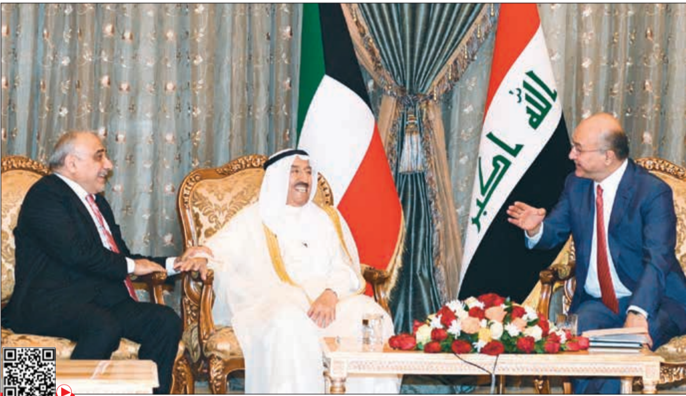
صاحب السمو الأمير الشيخ صباح الأحمد متوسطاً الرئيس العراقي براهيم صالح ورئيس الوزراء العراقي عادل عبدالمهدي خلال زيارة سموه التاريخية لبغداد أمس

■ ضرورة تذييل العقبات في ملفي إصدار سمات الدخول وتسهيل حركة البضائع والسلع بين البلدين