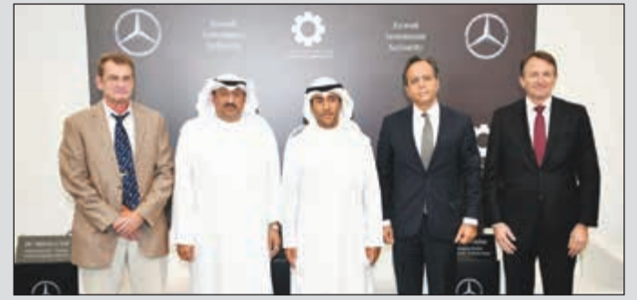
ممثلو الهيئة العامة للاستثمار والأكاديمية، والملا للسيارات

«الملا أوتوموبيلز» تفتتح أكاديمية الكويت لتقنية السيارات..