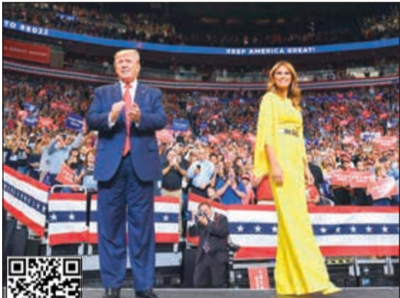
الرئيس دونالد ترامب والسيدة الأولى ميلانيا خلال إطلاق الحملة الانتخابية

عواصم - وكالات: أطلق الرئيس الأميركي دونالد ترامب رسمياً حملة إعادة انتخابه في 2020 بطريقة كرنفالية، تشبه كثيراً تلك التي وصل فيها إلى السلطة في 2016. ورغم أن استطلاعات الرأي تشير إلى أن خمسة من المرشحين الديموقراطيين على رأسهم جو بايدن، سيهزمونه إذا جرت الانتخابات الآن، أبدى ترامب ثقته بالفوز ومنتقداً معارضي الديموقراطيين، وأصفاً إياهم بمتطرفين يساريين مدفوعين بالكرهية، بينما تعهد بـ «زلزال في صناديق الاقتراع»، وقال: «فعلناها مرة وسنفعلها مجدداً». ومن خلال تجمع صاحب حضره نحو 20 ألفاً من أنصاره في أورلاندو بفلوريدا، عزف مجدداً على وتر القومية وأثار المخاوف من الهجرة غير الشرعية، وتعهد بتشييد الجدار الذي وعد به على طول الحدود مع المكسيك وبالدفاع عن حقوق العمال. ولم يتضمن خطاب ترامب الذي استمر لنحو 80 دقيقة أي أفكار مهمة جديدة أو خطط للمستقبل، لكنه أطلق وعداً بالتوصل إلى علاجاً للسرطان والإيدز وتمهيد الطريق لإرسال رواد فضاء إلى المريخ.