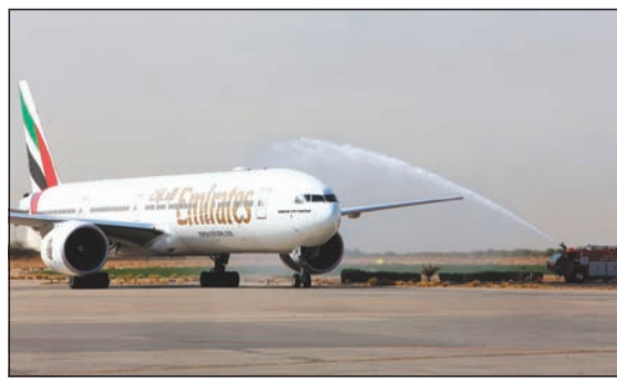
طائرة بوينغ 777-300ER المجهزة بمنتجات الدرجة الأولى الجديدة