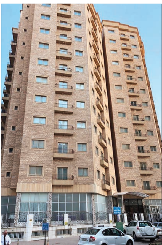
إحدى عقارات الهيئة الخيرية الإسلامية العالمية