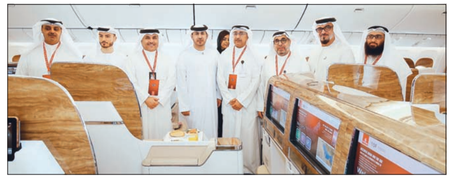
صورة جماعية لمسؤولي طيران الإمارات والطيران المدني

أجنحة خاصة مغلقة بالكامل في الدرجة الأولى مستوحاة من مرسيدس بنز