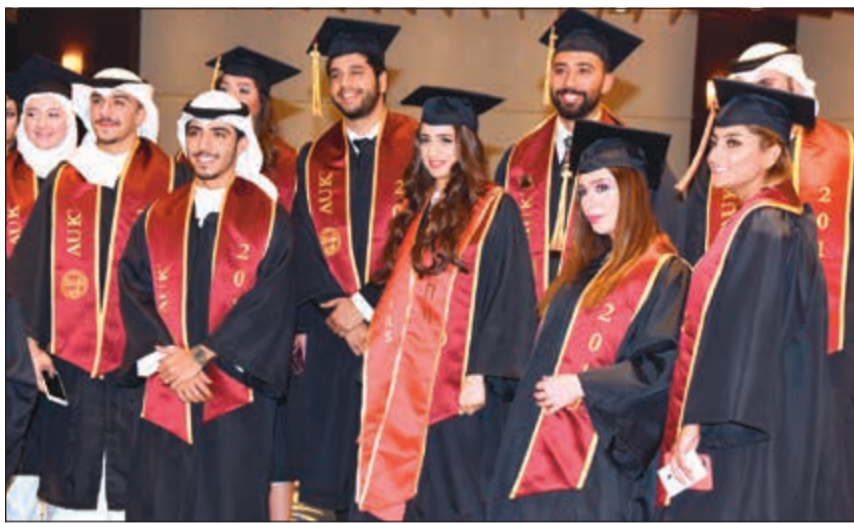
فرحة وتفاؤل بالمستقبل

احتفلت الجامعة الأمريكية في الكويت بيوم التخرج في الماضي بتخريج 437 طالباً وطالبة للعام 2019 منهم 285 طالباً في كلية الآداب والعلوم و152 طالباً من كلية الإدارة والاقتصاد من بينهم 7 خريجين حائزين مرتبة الشرف العليا، و19 خريجا حائزين مرتبة الشرف المتميزة، و21 خريجا حائزين مرتبة الشرف، حيث أقيم الحفل تحت رعاية وزير التربية ووزير التعليم العالي د.حامد العازمي.