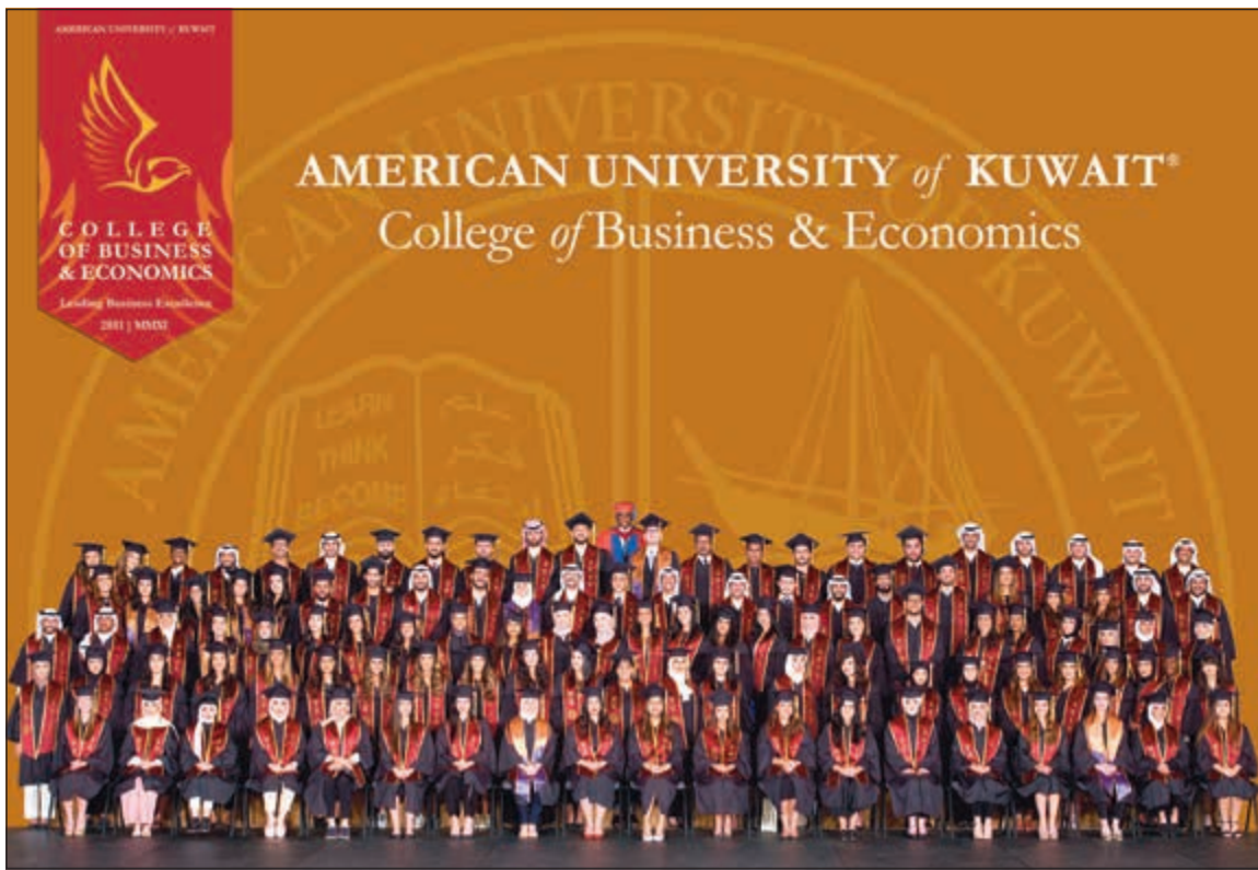
خريجو كلية الإدارة والاقتصاد خلال الحفل