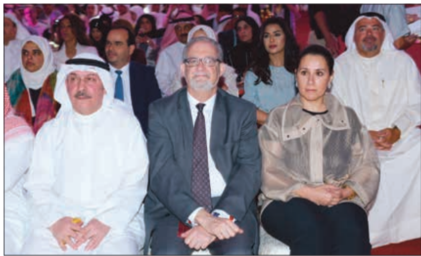
الشيخة دانة ناصر صباح الاحمد والسفير الأميركي لورانس سيلفرمان ودحبيب أبل

حضر الحفل رئيسة مجلس أمناء الجامعة الأمريكية في الكويت الشيخة دانة ناصر صباح الأحمد والأمين العام لمجلس الجامعات الخاصة د.حبيب أبل وأعضاء مجلس الأمناء والسلك الدبلوماسي وكبار الشخصيات وأهالي الخريجين وعائلاتهم. في بداية الحفل، رحبت نائب رئيس الجامعة التنفيذية أمل البنعلي بالضيوف وأهالي الخريجين في حفل التخرج الرابع عشر للجامعة وأعلنت بدء مراسم الاحتفال بدخول موكب أعضاء هيئة التدريس