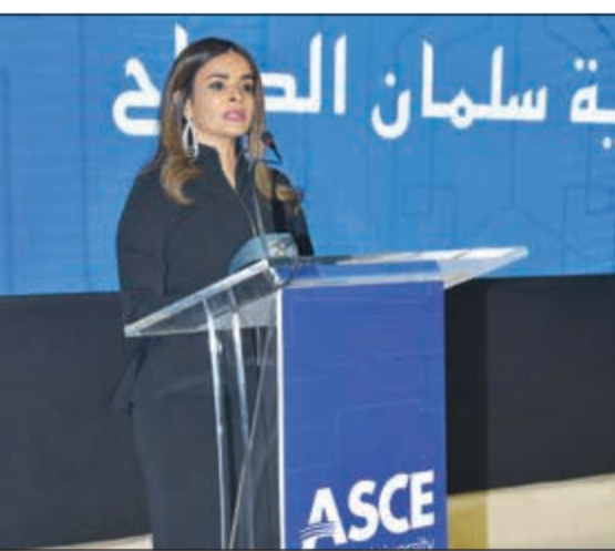
الشيخة درقية السلطان متحدة خلال الحفل

الكويتي. وأشاد الروضان بهذه المخرجات المتميزين الذين سيكونون إضافة قيمة لسوق العمل، لافتاً إلى أن السوق الكويتي شهد خلال العامين الماضيين أكثر من فرصة استثمارية ناجحة لمبادرين تحول مستثمروها