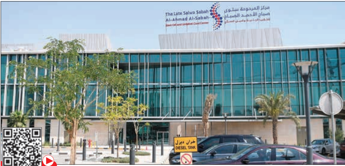
مركز سلوى صباح الأحمد للخلايا الجذعية الأول من نوعه في منطقة الخليج