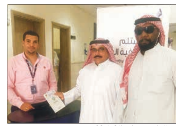
أحد المتقاعدين يتسلم بطاقة عافية الجديدة

تأول مرة في الكويت شاهد بتقنية الواقع المعزز حمل تطبيق Zappar