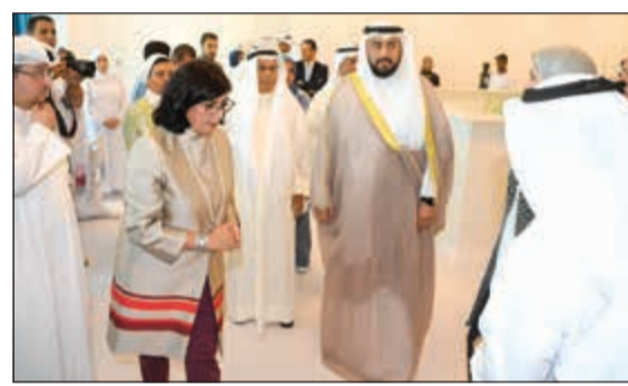
الشيخ دباسل الصباح خلال جولة بالمركز

وغيرها لصف الدم ومشتقاته والمحاضرات، بينما الدور الثاني يتكون من مختبرات مطابقة الأنسجة والإدارة، مبيّنا أن المركز سيتم تشغيله على مراحل وفقا للبرنامج الزمني والخطة الموضوعية لذلك، حيث أنه يفتح أبواب الأمل بالشفاء والتمتع بالحياة للعديد من المصابين بالأمراض المستعصية، خاصة الأطفال، مشيرا إلى أنه يعتبر إضافة واعدة غير مسبوقة، تضاف إلى الإنجازات التي تحققت من خلال إدارة خدمات نقل الدم بالوزارة. وأعرب عن ثقته في إدارة وتشغيل المركز من خلال الأطباء والباحثين والفنيين