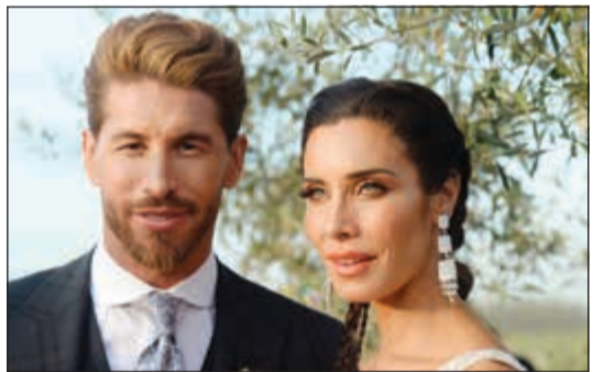
سيرخيو راموس وزوجته بيلا روبيو

حضر العديد من مشاهير كرة القدم الدولييين حفل زفاف قائد منتخب إسبانيا ونادي ريال مدريد سيرخيو راموس من صديقه مقدمة البرامج بيلا روبيو في أسبيلية. وقال الانتقالي «نعم» في كاتدرائية أسبيلية بحضور أكثر من 400 شخص لم يقتصر على عالم كرة القدم، وتمكن المشاهير من الفضوليين الذين اقتربوا من الكاتدرائية من مشاهدة لاعبين مثل الكرواتي لوكا مودريتش وجوردي ألبا والانجليزي المعتزل ديفيد بيسكام وزوجته فيكتوريا ورئيس نادي ريال مدريد فلورنتينو بيريز، فيما غاب زميل راموس السابق في ريال البرتغالي كريستيانو رونالدو المنتقل في الموسم الماضي إلى يوفنتوس الإيطالي.