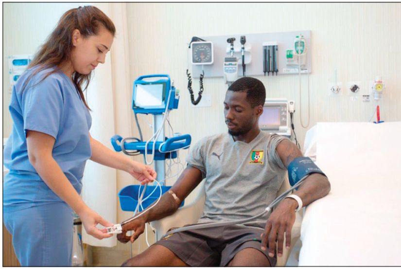
منتخب أسود الكاميرون ينهي فحوصاته الطبية الشاملة في «سبيتار» استعدادا لامم أفريقيا