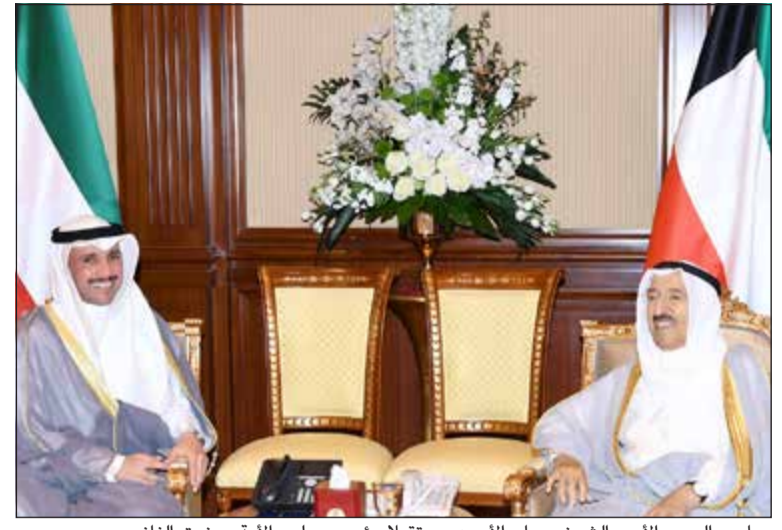
صاحب السمو الأمير الشيخ صباح الأحمد مستقبلاً رئيس مجلس الأمة مرزوق الغانم