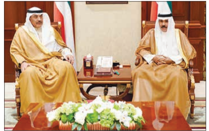
سمو ولي العهد الشيخ نواف الأحمد مستقبلاً الشيخ صباح الخالد

واستقبل سموه نائب رئيس مجلس الوزراء ووزير الداخلية الشيخ خالد الجراح. كما استقبل سموه نائب رئيس مجلس الوزراء ووزير الدولة لشؤون مجلس الوزراء أنس الصالح.