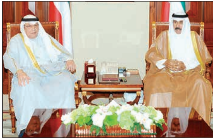
سمو ولي العهد الشيخ نواف الأحمد مستقبلاً الشيخ خالد الجراح

ورحب الخضمر بالضيف الكريم والوفد المرافق له في بلاده الثاني الكويت، متمنياً لهم طيب الإقامة خلال هذه الزيارة، والتي