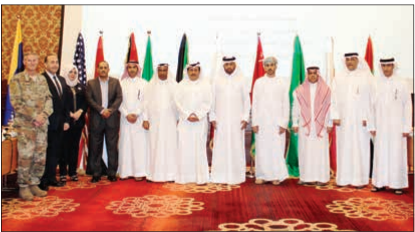
المشاركون في الاجتماع التحضيري الأول لتمرين «حسم العقبان 2020»

مارس 2020 إلى جانب توحيد مفاهيم العمليات العسكرية المشتركة لرفع قدرة الاستجابة للمشاركين وتعزيز التعاون والتنسيق العسكري المشترك وتطويره. وأضاف أن التمرين يعتبر من سلسلة تمارين «حسم العقبان» التي بدأت في عام 2000 عندما استضافت مملكة البحرين التمرين الأول، مشيرة إلى أن استضافة الكويت لهذا التمرين للمرة الثالثة على التوالي يعد مكسباً استراتيجياً.