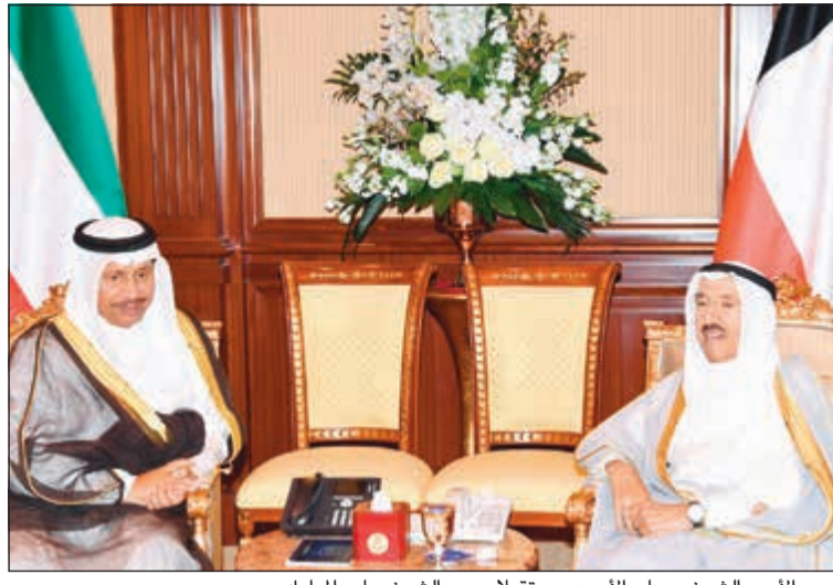
سمو الأمير الشيخ صباح الأحمد مستقبلاً سمو الشيخ جابر المبارك