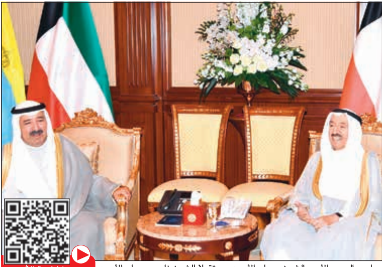
صاحب السمو الأمير الشيخ صباح الأحمد مستقبلاً الشيخ ناصر صباح الأحمد