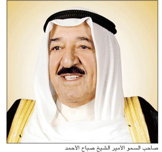
صاحب السمو الأمير الشيخ صباح الأحمد

صاحب السمو جدد الدعوة للرئيسين الروسي والصيني لزيارة الكويت