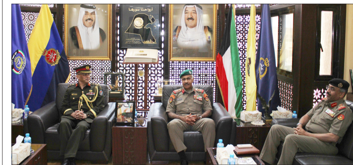
الفريق الركن محمد الخضر مستقبلا الملحق العسكري البنغلاديشي العميد ساقير شاه

استقبل رئيس الأركان العامة للجيش الفريق الركن محمد الخضر بمكتبه ظهر أمس الملحق العسكري البنغلاديشي لدى البلاد العميد ساقير شاه، وذلك بمناسبة انتهاء مهام عمله في منصبه. هذا، وقد وجه الخضر شكره وتقديره للعميد ساقير شاه، على ما قام به من جهود أثناء فترة عمله، متمنيا له التوفيق والنجاح في حياته القادمة. حضر اللقاء مدير شؤون الملحقين والبعثات العسكرية العميد الركن مساعد خزام الحمدان.