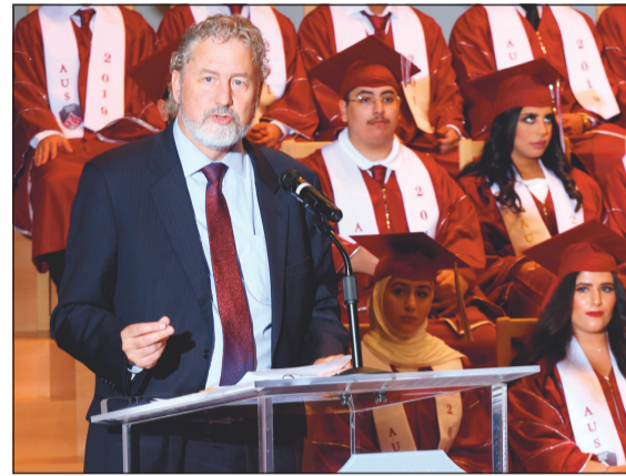
نائب السفير الأمريكي في الكويت لاري ميموت يلقي كلمته

داعيا الخريجين إلى الشعور بالفخر والالتزام بالمسؤولية كونهم أول دفعة خريجين من المدرسة الأمريكية المتحدة في الكويت. وتأسست المدرسة الأمريكية المتحدة في الكويت عام 2012 وهي معتمدة دوليا من قبل مجلس المدارس العالمية «CIS» ورابطة المدارس المتوسطة «MSA».