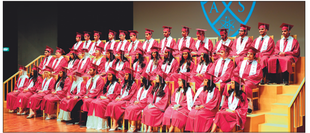
صورة جماعية لخريجي الدفعة الأولى لعام 2019