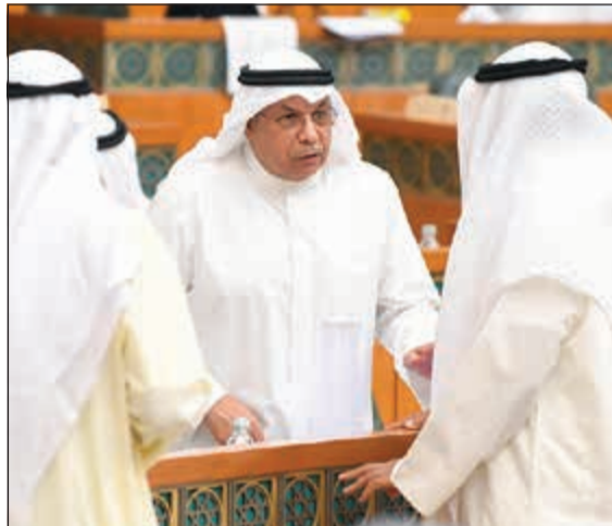
الشيخ خالد الجراح خلال الجلسة