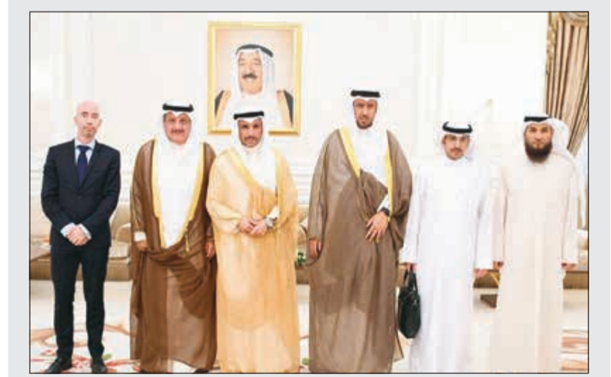
الرئيس الغانم ونائبه عيسى الكندري وعبدالوهاب البابطين ود. فهد العفاسي وعلام الكندري

توجه رئيس مجلس الأمة مرزوق الغانم إلى مدينة لاهاي الهولندية أمس للمشاركة في المنتدى العالمي لثقافة السلام التي تنظمه مؤسسة عبدالعزيز سعود البابطين الثقافية. وكان في وداع الغانم على أرض المطار نائب رئيس مجلس الأمة عيسى الكندري ووزير العدل ووزير الدولة لشؤون مجلس الأمة المستشار د. فهد العفاسي وأمين عام مجلس الأمة علام الكندري. ومن المقرر أن يلقي الغانم خلال الجلسة الختامية للمنتدى كلمةً تتعلق بإشاعة ثقافة السلام كسبيل وحيد للعيش. ويرافق الغانم خلال مشاركته في المنتدى النائبان عبدالوهاب البابطين وعمر الطبطبائي كما يشهد المنتدى مشاركة حكومية كويتية ممثلة بوزير التربية ووزير التعليم العالي دحامد العازمي ووزير الإعلام ووزير الدولة لشؤون الشباب محمد الجبري. ويشترك في المنتدى الذي تنظمه مؤسسة البابطين الثقافية بشراكة مع عدد من الشركاء الدوليين من بيننا اللجنة الدولية للصليب الأحمر ومعهد السلام العالمي، عدد كبير من الوجوه الثقافية والسياسية في العالم من بينهم