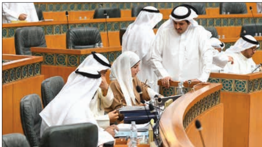
جانب من جلسة أمس